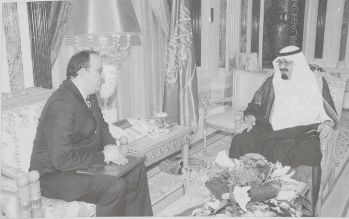
السلمة الإقليمية للمملكة العربية السعودية وشكر جلالته المولى عز وجل أن مكن القوات السعودية الباسلة من رد المعتدين الظالمين وتطهير المناطق الحدودية الجنوبية وإحكام السيطرة على كل شبر من أراضي المملكة . وقد حمل خادم الحرمين الشريفين الملك عبدالله

كما تضمنت الرسالة التي سلمها لخادم الحرمين الشريفين معالي وزير الخارجية والتعاون المغربي الأستاذ الطيب الفاسي الفهري خلال استقبال الملك المفدى له في مكتبه بالديوان الملكي في قصر اليمامة يوم الثلاثاء ٢٢ ذو القعدة ١٤٣٠ هـ الموافق ١٠ نوفمبر ٢٠٠٩ م إدانة المغرب بكل قوة وحزم التجاوزات الهوجاء وأن أي تطاول أو تحريض على سيادة المملكة العربية السعودية يعتبر عملاً تخريبياً موجهاً كذلك ضد المغرب وفعلاً إجرامياً دنيئاً يتعارض مع تعاليمنا وقيمنا الإسلامية وأن المغرب سيظل سندا قوياً ومناصرًا ثابتاً لحقوق المملكة العربية السعودية السيادية الكاملة ومتصدياً صلباً لكل الحاقدين والمتآمرين على