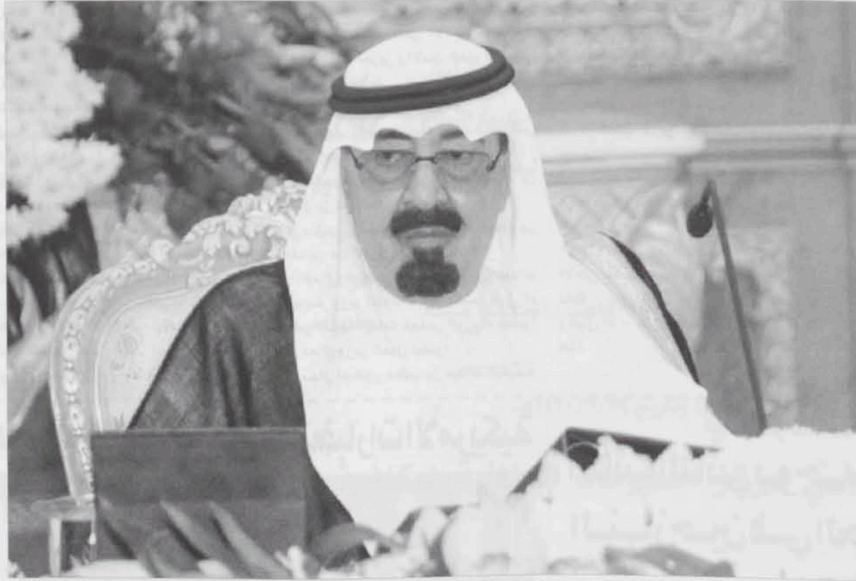
المليك يوجه القطاعات ذات العلاقة بخدمة الحجاج وتوفير كل ما يحتاجونه من خدمات وتسهيلات