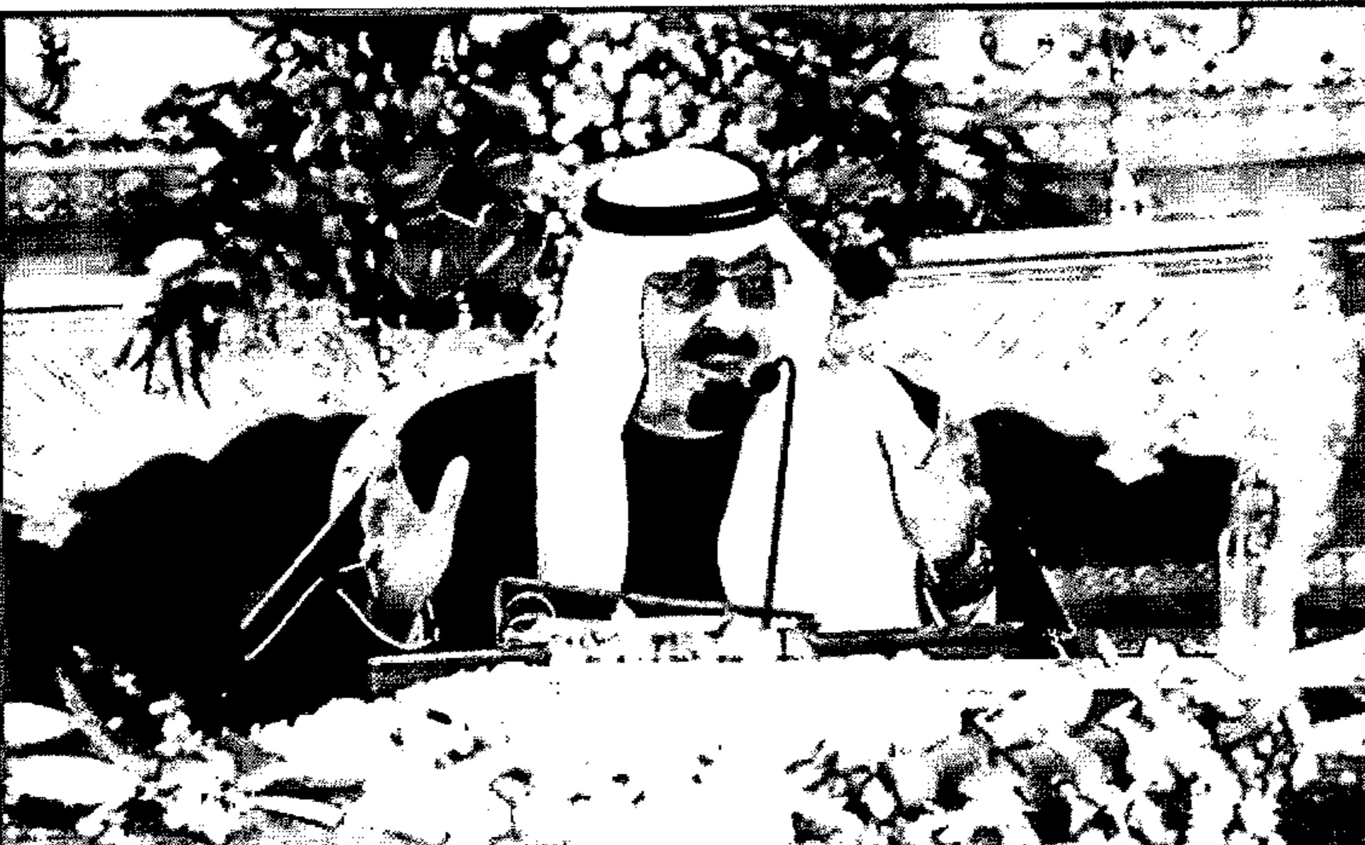
تفاصيل ص ٢

الرياض - واس رأس خادم الحرمين الشريفين، الملك عبدالله بن عبدالعزيز آل سعود - حفظه الله - الجلسة التي عقدها مجلس الوزراء، بعد ظهر يوم الاثنين ٢٩ محرم ١٤٣٠ هـ الموافق ٢٦ يناير ٢٠٠٩ م في قصر اليمامة بمدينة الرياض. وفي مستهل الجلسة، أطلع خادم الحرمين الشريفين المجلس على مجمل اللقاءات والاتصالات والمشاورات، التي أجراها - أيده الله - مع قادة الدول الشقيقة والصديقة ومسؤولي الهيئات والمنظمات الدولية ومبعوثيهم؛ ومنها لقاءاته - حفظه الله - بإخوانه أصحاب الجلالة والفخامة والسمو قادة الدول العربية في دولة الكويت، خلال انعقاد القمة العربية الاقتصادية والتنموية والاجتماعية - قمة التضامن مع الشعب الفلسطيني في غزة - وكذا الاتصال الهاتفي الذي تلقاه من فخامة الرئيس باراك أوباما رئيس الولايات المتحدة الأمريكية، ووزيرة الخارجية الأمريكية؛ وتأكيداته - أيده الله - خلالهما على القضية الفلسطينية، وما عاناه الشعب الفلسطيني خلال الأيام الغصيبة من جراء العدوان الإجرامي الظالم على قطاع غزة والتفكيك بأمله دون أي اعتبار للقيم والمثل الإنسانية والعدالة الدولية. وأوضح معالي وزير النقل والثقافة والإعلام بالنياحة الدكتور جبار بن عبد الصميري، في بيانه لوكالة الأنباء السعودية عقب الجلسة، أن المجلس شدد على أهمية ما تضمنته الكلمة السامية، التي ألقاها خادم الحرمين الشريفين في أعمال مؤتمر القمة العربية الاقتصادية والتنموية والاجتماعية التي عقدت في الكويت منتصف الأسبوع الماضي من أفكار خلاقة للتأسيس للعمل المشترك، ودعوة لنهذ الخلافات والفرقة وقطع الطريق على كل من أراد عرقلة التضامن ووحدة الموقف.