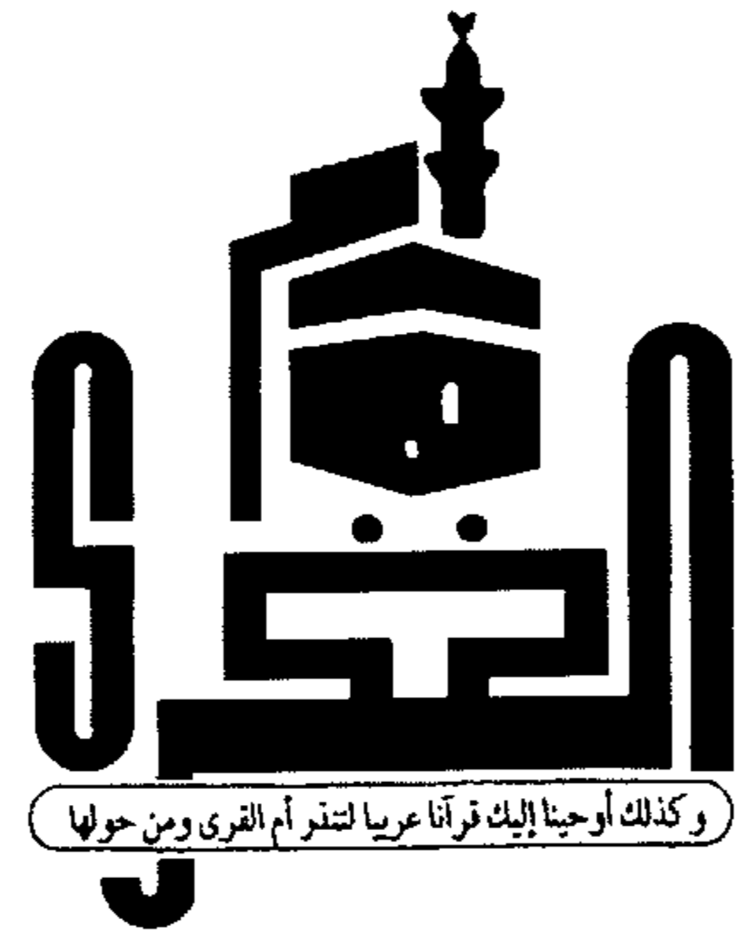
وكذلك أوحينا إليك قرآنا عربيا لتنير أم القري ومن حولها

الأخبار ٥٥ صفحة ٦٠ • • الثمن ٣ ريالات سعودية