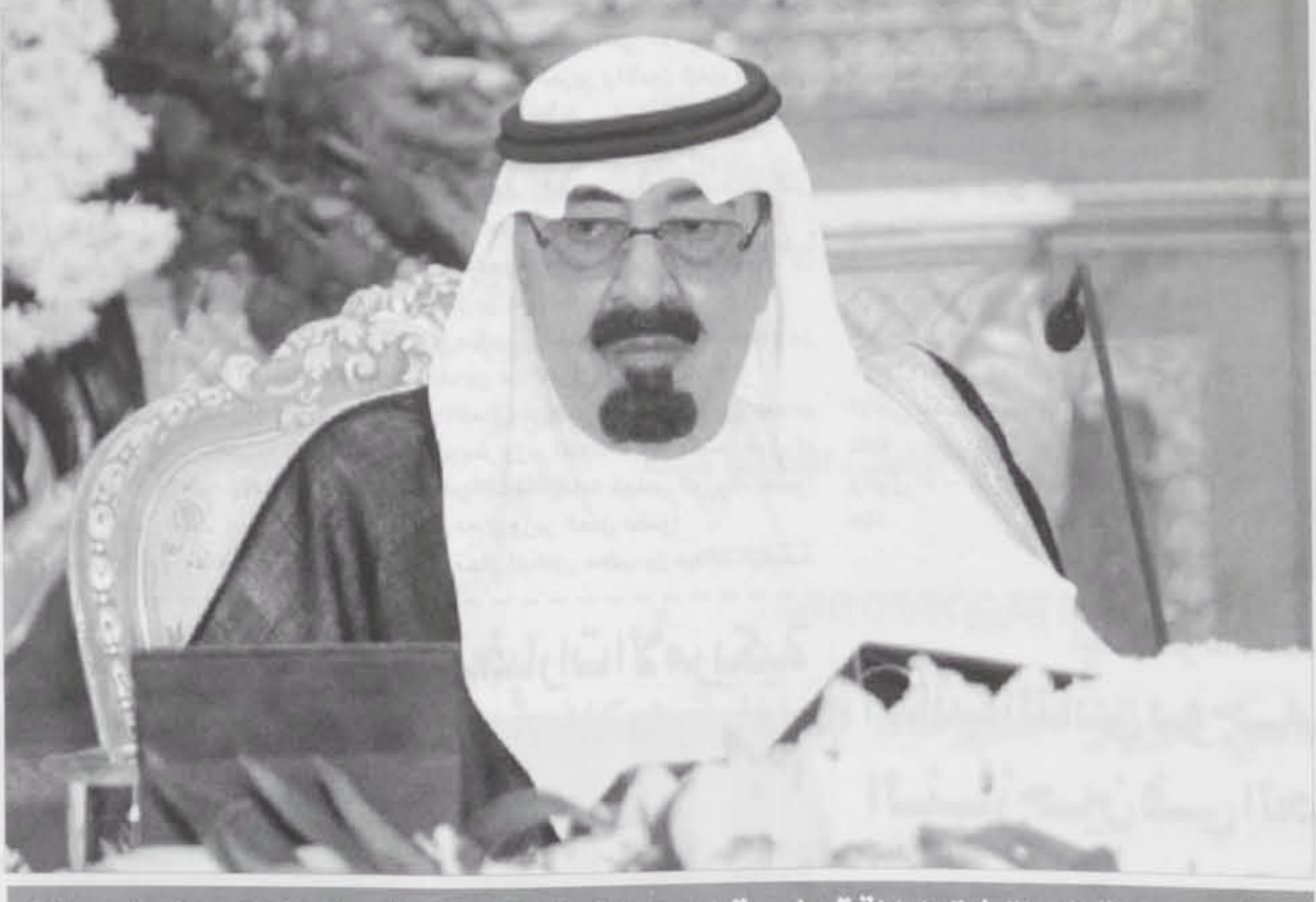
المليك يوجه القطاعات ذات العلاقة بخدمة الحجاج وتوفيركل ما يحتاجونه من خدمات وتسهيلات

وبين معاليه أن المجلس استعرض بعد ذلك جملة من التقارير حول تطورات الأوضاع في المنطقة والعالم وثمن في هذا الشأن ما عبرت عنه دول مجلس التعاون لدول الخليج العربية من تضامن مع المملكة العربية السعودية ودعم لحقها في المحافظة على سلامة أراضيها وأمن مواطنيها وأن أي مساس بأمن واستقرار المملكة هو مساس بأمن وسلامة كافة دول المجلس وذلك خلال الاجتماع الثاني للمجلس الوزاري لأصحاب السمو والمعالي وزراء خارجية دول المجلس الذي اختتم في الدوحة