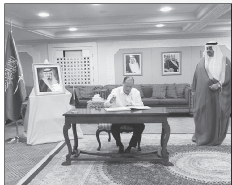
.. ويسجل كلمته

عقد فخامة رئيس جمهورية الفلبين بينينغو سيميون أكينو الثالث صادق العزاء والمواساة في فقيد الأمة خادم الحرمين الشريفين الملك عبدالله بن عبدالعزيز - رحمه الله - خلال زيارته لمقر سفارة خادم الحرمين الشريفين في مانيلا. وقال فخامة الرئيس الفلبيني في كلمته التي سجلها في سجل الزيارات بالسفارة: نيابة عن الشعب الفلبيني، أتقدم بخالص التعازي لخادم الحرمين الشريفين الملك سلمان بن عبدالعزيز آل