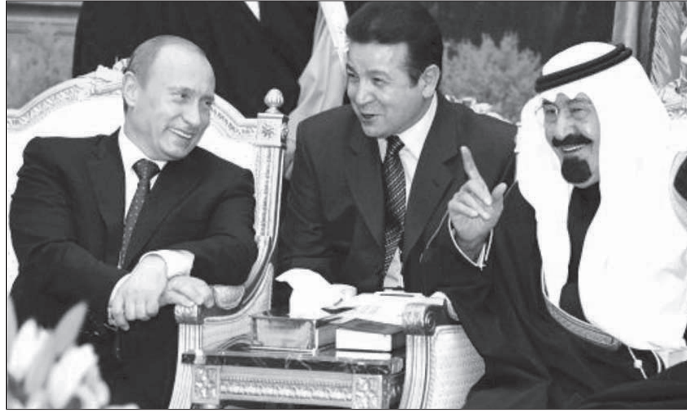
حديث بين بسم الراحل الملك عبدالله والرئيس الروسي بوتين

أوجدت الدبلوماسية السعودية خلال العقد الماضي والتي قادها خادم الحرمين الشريفين الملك عبدالله بن عبدالعزيز - رحمه الله - حالة من تشعب العلاقات بين المملكة ودول العالم، وهو ما تجلى في الاستقطاب الكبير الذي شهدته الرياض خلال الأيام الماضية بشكل لافت. وكان لرغبة الراحل الملك عبدالله بن عبدالعزيز في تكوين علاقات مع الجميع أثر رجعي إيجابي إذ سمح ذلك وانعكس على كل الصعيد سواء السياسي أو الاقتصادي وحتى الثقافية.