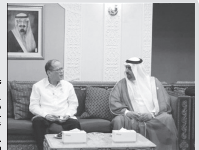
الرئيس الفلبيني في زيارته لسفارة المملكة في مانيلا

عقد فخامة رئيس جمهورية الفلبين بينينغو سيميون أكينو الثالث صادق العزاء والمواساة في فقيد الأمة خادم الحرمين الشريفين الملك عبدالله بن عبدالعزيز - رحمه الله - خلال زيارته لمقر سفارة خادم الحرمين الشريفين في مانيلا. وقال فخامة الرئيس الفلبيني في كلمته التي سجلها في سجل الزيارات بالسفارة: نيابة عن الشعب الفلبيني، أتقدم بخالص التعازي لخادم الحرمين الشريفين الملك سلمان بن عبدالعزيز آل