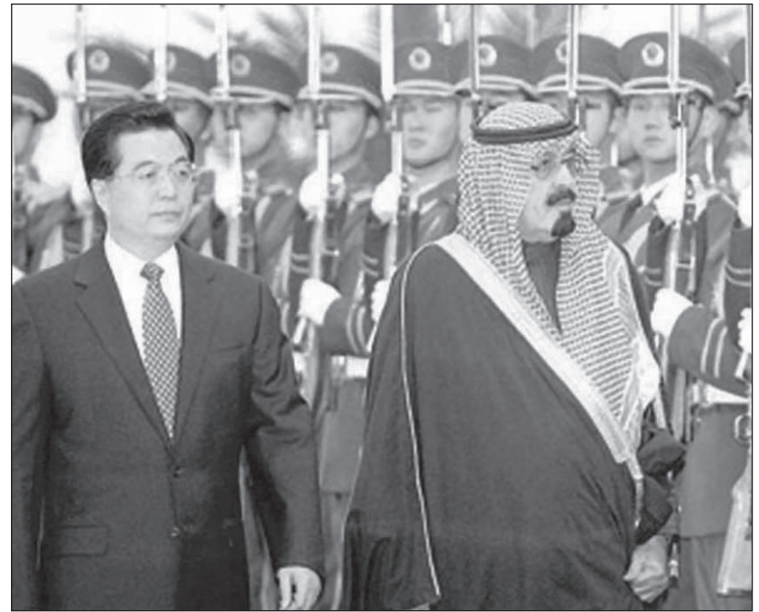
الملك عبدالله مستقبلاً بطاوة من الرئيس الصيني هوجينتاو

الشؤون الداخلية للدول، وهو ما أكسبها تقديراً شهده العالم الذي تقاطر على الرياض. لقد أدت السياسات الحكيمة التي انتهجها خادم الحرمين الملك عبدالله بن عبدالعزيز خصوصاً في مجالي النفط ومكافحة الإرهاب إلى جعل المملكة محل ثقة خصوصاً عندما يتعلق الموضوع بأمرين شديدي الحساسية وهما