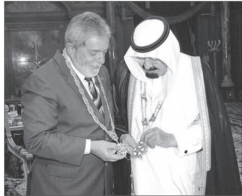
خادم الحرمين الملك عبدالله والرئيس البرازيلي ولكريم متبادل

مجلس الأمة الكويتي ينوه بمنجزات فقيد الأمة: