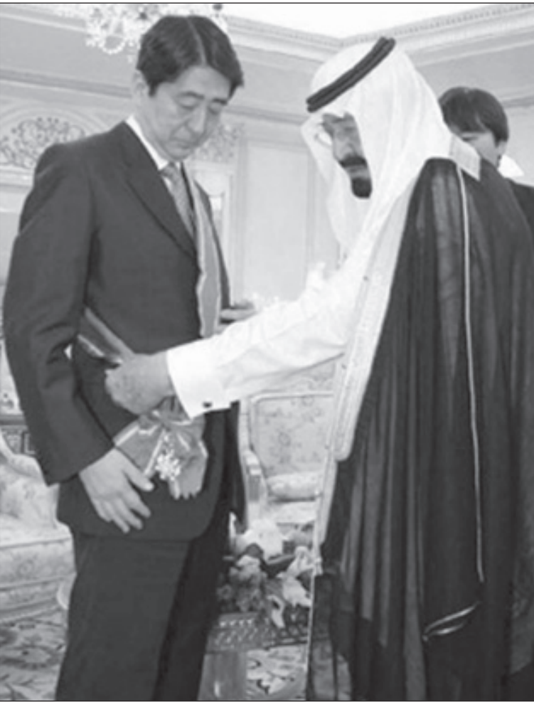
خادم الحرمين الملك عبدالله - رحمه الله - ورئيس الوزراء الياباني أبي

كما أبرزت تلك العلاقات دور المملكة كفاعل رئيسي في المنطقة التي ومنذ أحداث ١١ سبتمبر تعيش على واقع متأزم لا تنفك تعيشه ويتوقع أن يستمر خلال العقد المقبل. وكان لسياسة الملك عبدالله بن عبدالعزيز - رحمه الله - المتوازنة مع كل الدول والمبنيّة على الاحترام المتبادل وعدم التدخل في