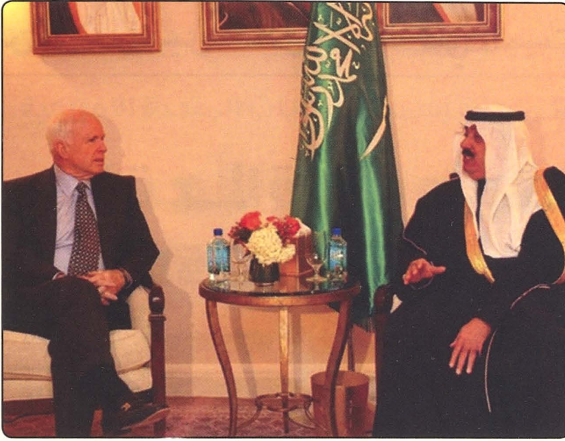
صاحب السمو الملكي الأمير متعب بن عبد الله في لقائه مع ماكين جون