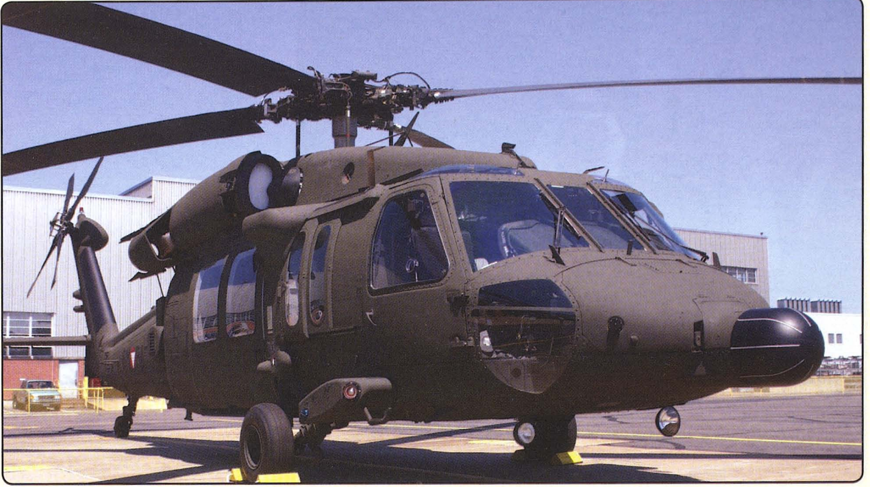
طائرة بلاك هوك