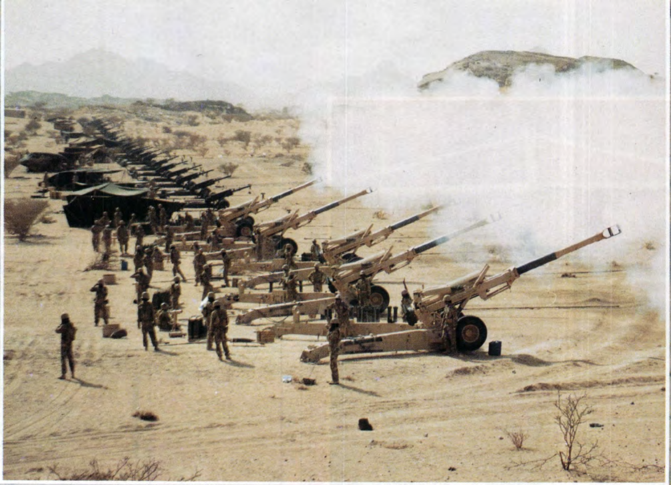
نيران المدفعية في إحدى مراحل التمرين.