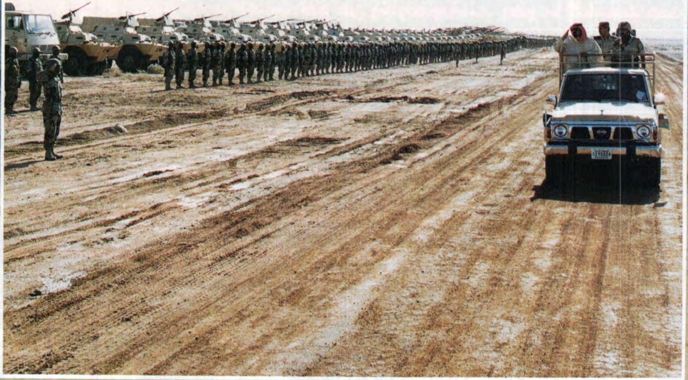
سمو ولي العهد نائب رئيس مجلس الوزراء ورئيس الحرس الوطني يستعرض أحد الألوية المشاركة في التمرين.

التمرين (فاتح خير) أول تلك التمارين، ويهدف هذا التمرين إلى معرفة مدى ملائمة التشكيل الجديد لكتيبة أسلحة مشتركة لتنفيذ المهام القتالية. وقد نفذ هذا التمرين في جنوب منطقة الرياض وتوالت بعد ذلك التمارين الميدانية بالذخيرة الحية.