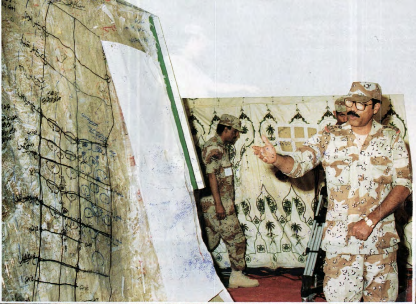
العبيد الركن بندر بن ناهل رئيس هيئة العمليات بالحرس الوطني، نائب قائد التمرين يقدم شرحاً عن مراحل التمرين.