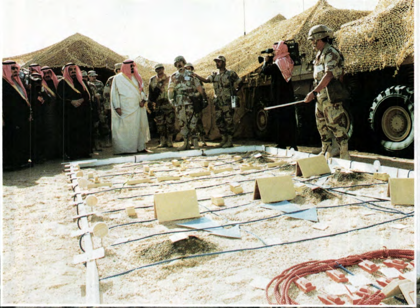
سمو ولي العهد نائب رئيس مجلس الوزراء رئيس الحرس الوطني يستمع إلى شرح عن طبيعة الأرض وموقف القوات من ركن عمليات لواء الإمام محمد بن سعود.

● التدريب على تأسيس وإدامة الاتصالات الإدارية والتعبوية بين الوحدات ومراكز العمليات.