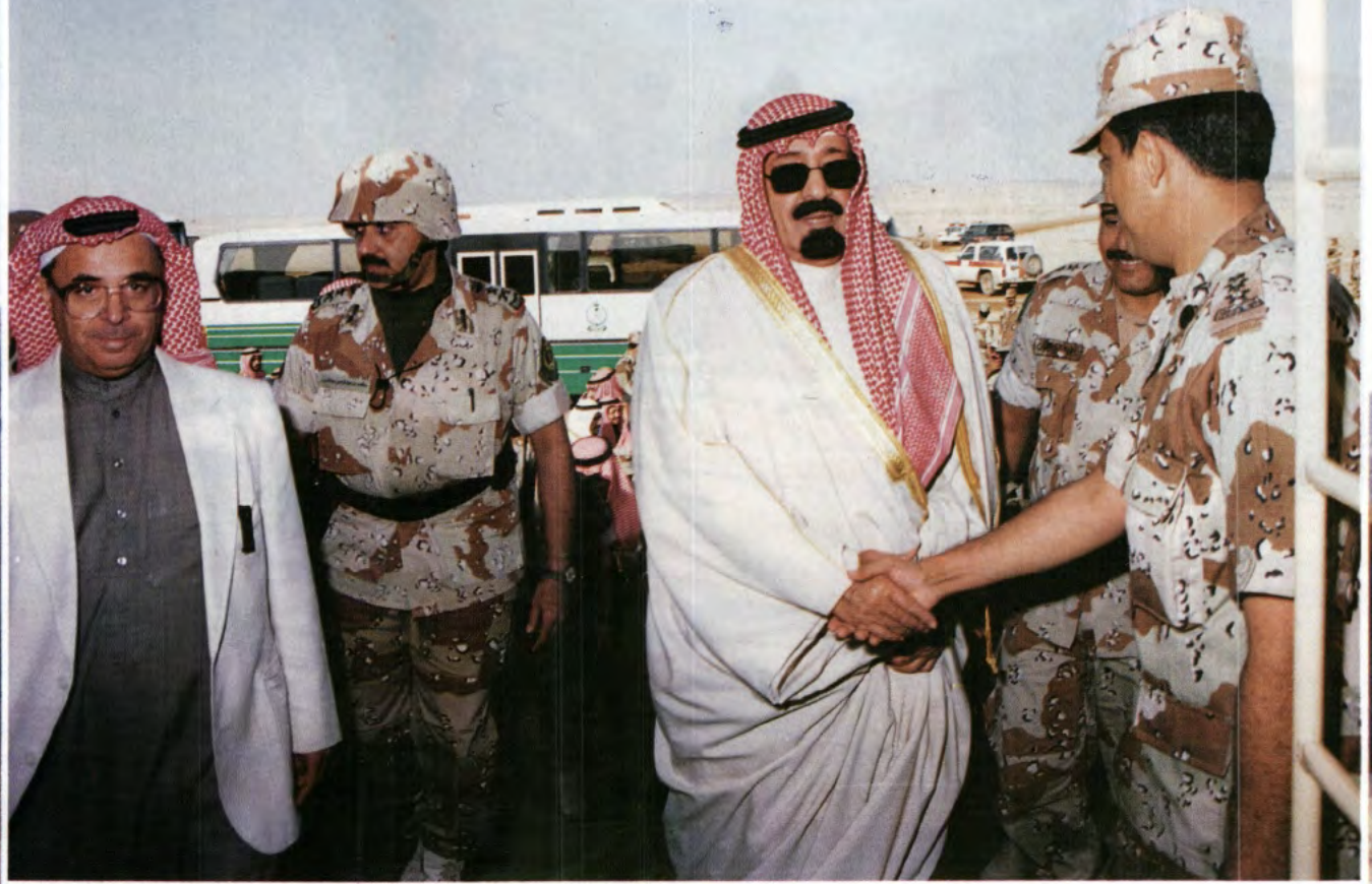
معالي المدير العام التنفيذي للشئون الصحية بالحرس الوطني في استقبال سمو ولي العهد أثناء تفقده سموه لقيادة الطب العسكري الميداني.

التخطيط والإعداد والتنسيق وتنفيذ المناورة. حيث قامت وحدات هندسة القتال بواجباتها المتمثلة بمختلف عمليات هندسة القتال في أوجه العمليات المتعددة التي منها إنشاء الطرق، وفتح الثغرات، وتحصين المواقع الدفاعية، وحفر الخنادق، وإنشاء الأسلاك الشائكة، وتهيئة حقول الألغام لإعاقة تقدم قوات العدو، وتجهيز مسرح عمليات المناورة بكل المتطلبات القتالية، إلى غير ذلك من عمليات إسناد الوحدات المقاتلة التي اشتركت في المناورة.