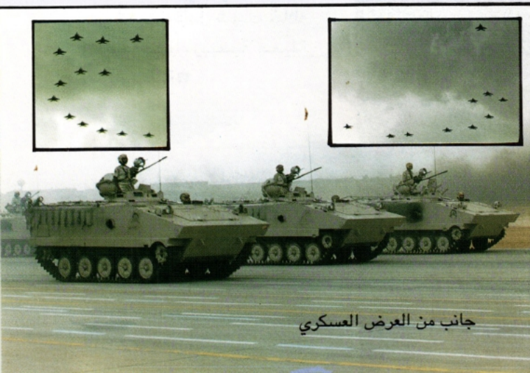
جانب من العرض العسكري