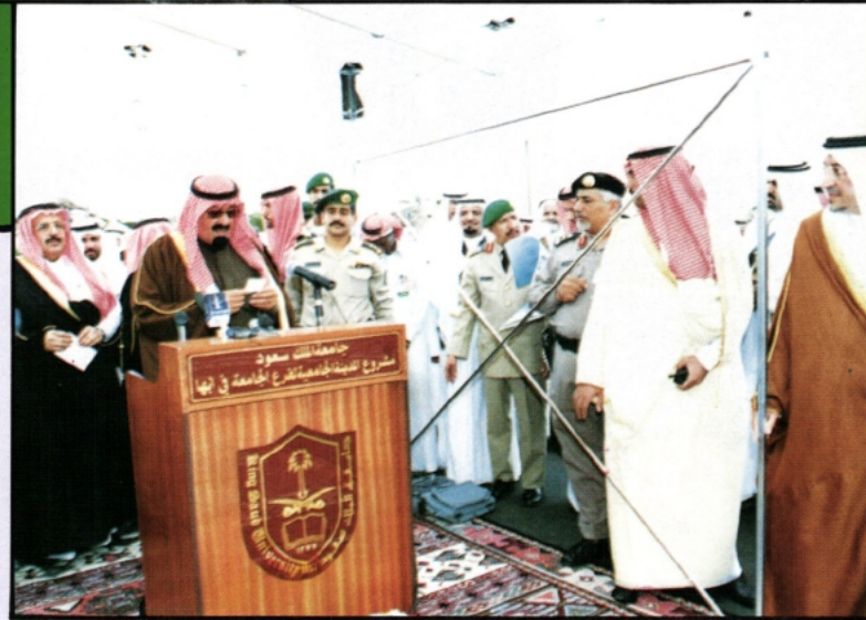
سومه يعلن إطلاق اسم الملك خالد بن عبد العزيز على الجامعة بدلاً من اسمه

كما شرف سومه - يحفظه الله - الاحتفالات التي أقامها أهالي المنطقة احتفاءً بمقدم سومه. ومن المشاريع التي افتتحها سومه أو وضع حجر الأساس لها: