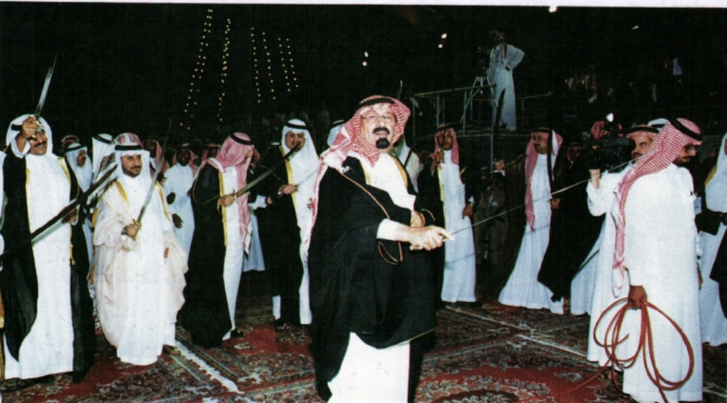
إحدى مشاركات سموه في احتفالات أهالي المنطقة

رمزية من وحدات القوات المسلحة بالمنطقة الجنوبية بخميس مشيط، حيث شاهد سموه عرضاً لإمكانات الدبابة الجديدة (ابرامز م/ ٢٠) وعربة القتال (برادلي) وتشكيلات جوية متنوعة بمختلف الطائرات، وافتتح عدداً من المنشآت العسكرية.