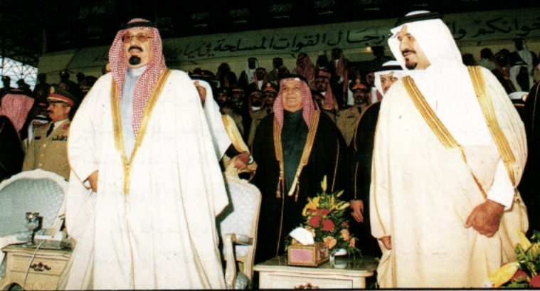
سموه شرف العرض العسكري يرافقه سمو النائب الثاني

● كما شرف سموه في اليوم نفسه العرض العسكري لمجموعة