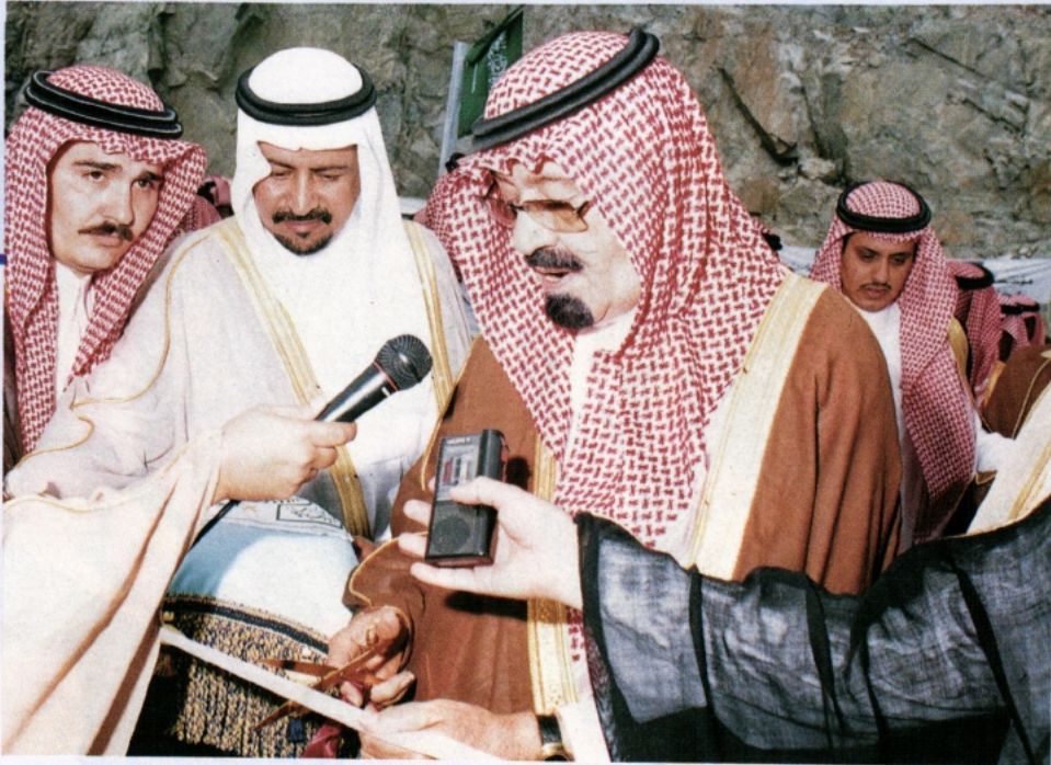
سموه يقص الشريط إيذانا بافتتاح سد الملك فهد ببيشة