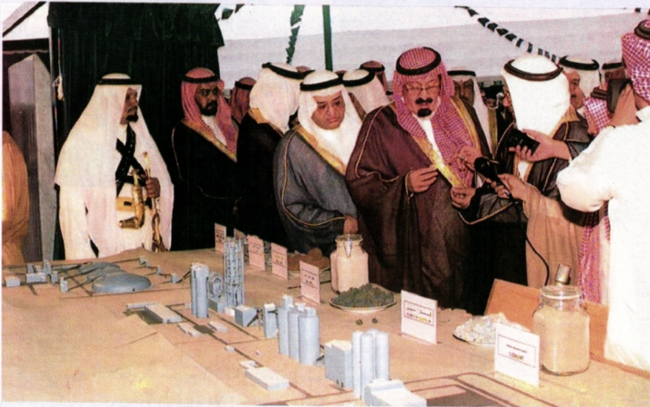
سموه يفتتح مصنع أسمنت المنطقة الجنوبية