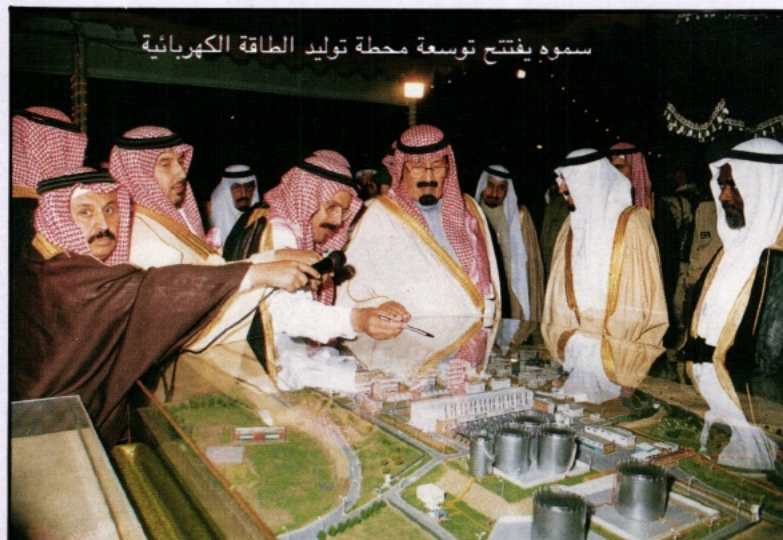
سومه يفتتح توسعة محطة توليد الطاقة الكهربائية