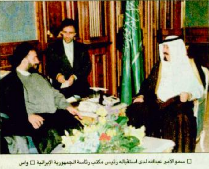
□ سمو الأمير عبدالله لدى استقباله رئيس مكتب رئاسة الجمهورية الإيرانية □ واس

بكين مستعدة لمساعدة تايبيه أكثر من ٦١٢٠ بين قتيل وجريح مع ١٨٠٠ هزة ارتدادية بتايوان □ العواصم - الوكالات: ضربت هزة ارتدادية بقوة ٦,١ على مقياس ريختر المناطق القريبة من منتجج البشان الجبلي وسط تايوان وسجل حدوث أكثر من ١٨٠٠ هزة ارتدادية. وقتلت التلوث في الزلازل بقوة تتراوح بين ٧,٦ و ٨,٠ على مقياس ريختر قد خلف وحسب المصادر التلوثية الرسمية عن مقتل حوالي ١٧١٢ وجرح أكثر من ٤٤٠٠ شخصا آخرين وأن حوالي ٦١٢ شخصا آخرين في عداد المفقودين. ومن ناحية أخرى تمكنت فرق الإنقاذ من إنقاذ نحو مائة شخص حتى من تحت أنقاض مبنى مكون من ١٢ طابقا غير أن بعضهم مصاب بإصابات خطيرة. وما زالت فرق الإنقاذ تبحث عن ناجين من تحت الأنقاض. وقتلت تقريبا لأربعة أن الزلازل تسبب في العراق نصف جزيرة ثوان في الظلام ونهب عدد كبير من الليالي في البغية، ص ٢٣، طالع ص ٢٥