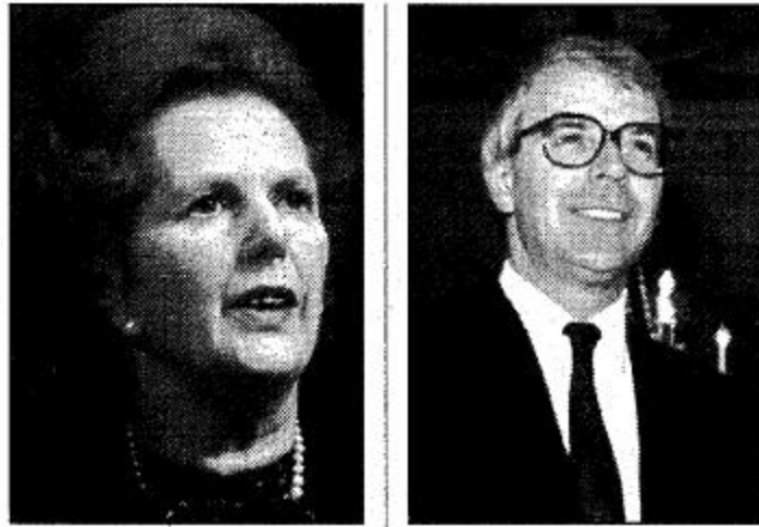
مييجور □ ناشر □