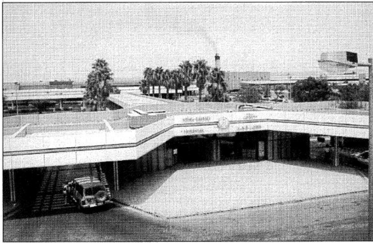
المرافق الصحية التي تخدم رجال الحرس وعائلاتهم

٣٥ مستشفى متخصصاً وعشرات المستوصفات الثابتة والمتنقلة في أماكن تواجد رجال الحرس وعائلاتهم