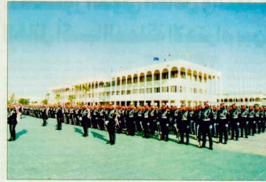
كلية الملك خالد العسكرية صناعة الرجال