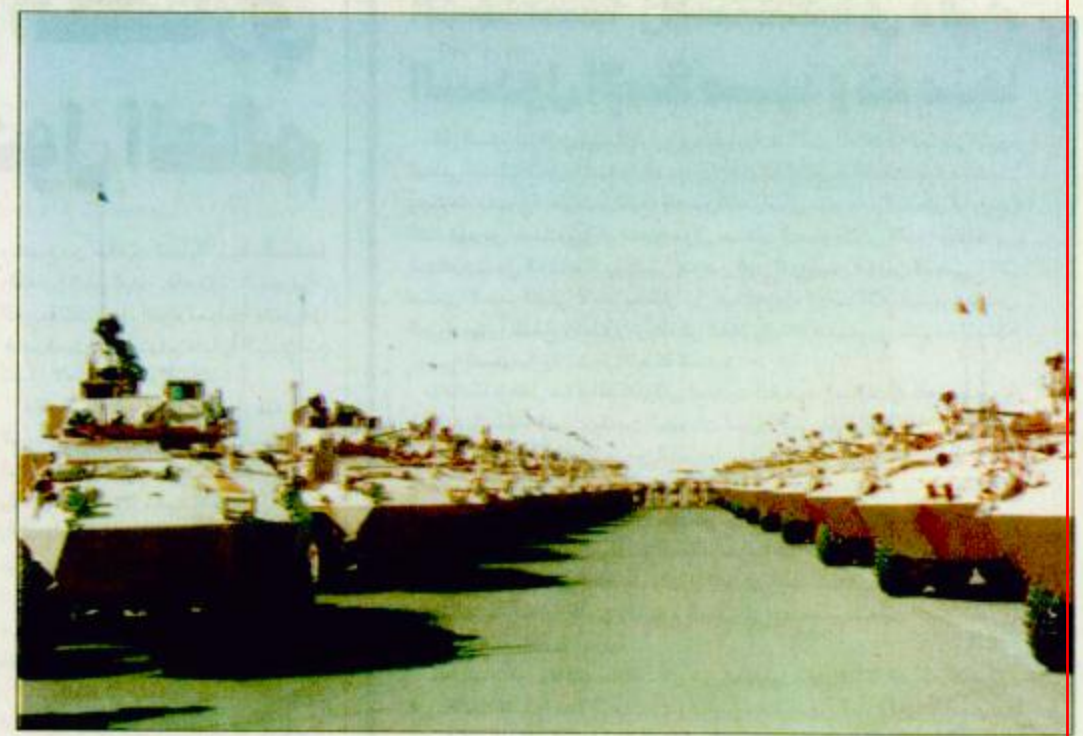
قواتنا المسلحة مرع الوطن