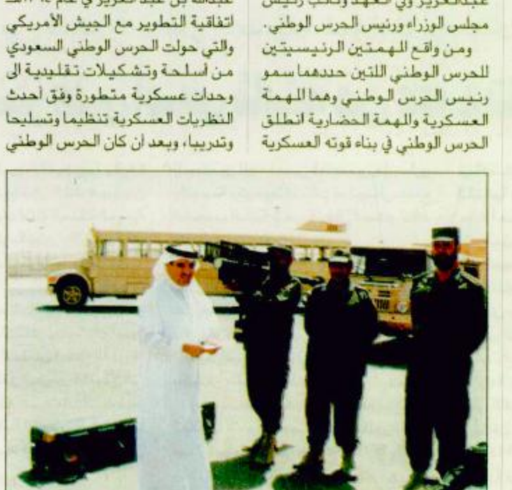
«جزيرة» في موقع البادين العسكرية مع الضباط والاراد