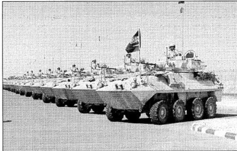
رجال الحرس الوطني. فوق ظهور دباباتهم

مجال تعليم الكبار منح المجلس العالي لتعليم الكبار ومقره كندا جائزته هذا العام ١٩٩٩ إلى وكالة الحرس الوطني للشؤون الثقافية والتعليمية تقديراً لجهودها في مجال التنمية البشرية من خلال برامج التربية والتعليم ومحو الأمية التي تقدمها لمنسوبي الحرس الوطني وكافة أفراد المجتمع بناء على ترشيح تقدمت به إلى المجلس وزارة المعارف في المملكة العربية السعودية مرفقة به تقريراً يوضح جهود الحرس الوطني في هذا المجال حرصاً من الوزارة على استمرار عضوية المملكة في المنظمات الدولية والإقليمية التي تعنى الوزارة من الشهادة الابتدائية لتعليم الكبار حتى عام ١٤١٨هـ - ١٤١٩ (١٩٨٨) دارسة. كما وأصل العديد من خريجي مراكز تعليم الكبار بالحرس الوطني تعليمهم العالي في الجامعات السعودية.