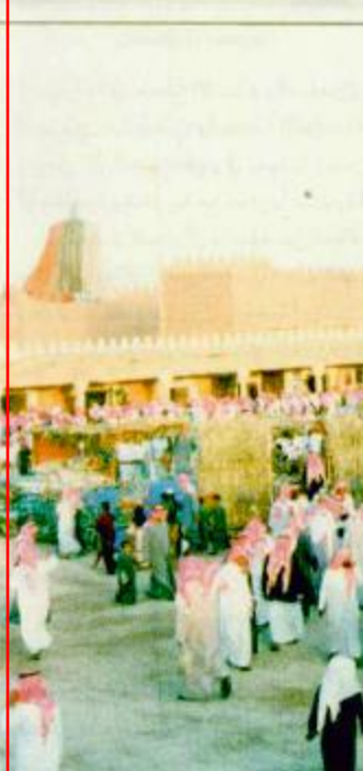
المهرجان الوطني للتراث والثقافة جمعوا ضيوف الحرس الوطني

مجلة الحرس الوطني وفي عام ١٣٩٠هـ صدرت الموافقة السامية على إصدار مجلة الحرس الوطني بحيث تكون مجلة عسكرية ثقافية وقد قامت إدارة العلاقات العامة بإصدار اللجة بالبيدية بصورة فصلية في عام ١٤٠٠هـ ثم استمر صدورها شهرياً كواحدة من أهم المطبوعات المتخصصة في العالم العربي.