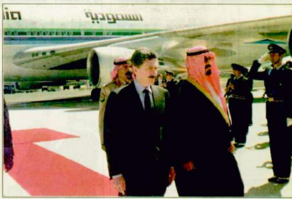
وصول سمو ولي العهد إلى إيطاليا بين البلدين الصديقين. وأنه بان سمو ولي العهد سيبحث مع القيادة الإيطالية العديد من الموضوعات الثنائية ذات الأهمية الاستراتيجية والسياسية في الشرق الأوسط وخصوصاً وضع مدينة القدس. لهذه الزيارة يمكن معرفة مدى الاحترام والتقدير اللذين يكنهما الجانب الإيطالي للمملكة ملكاً وحكومة وشعباً والأهمية البالغة التي تولونها لشخص سمو ولي العهد حفظه الله.