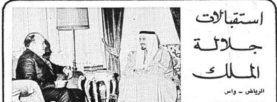
استقبل جلالته الملك خالد بن عبد العزيز المفدى في الساعة الحادية عشرة من صباح امس الجنرال رضا عظيمي وزير الحربية السورية وحضر القابلة صاحب السمو الملكي الامير سلطان بن عبد العزيز وزير الدفاع والطيران والمفتش العام وصاحب السمو الملكي الامير سلمان بن عبدالعزيز امير منطقة الرياض وسعادة السفير الإيراني لدى المملكة.

الجنوب يعتبر مشكلة امن داخلية بالنسبة للبنان. وذكر زعيم الكتائب اللبنانية ان هناك هدفين يجب تحقيقهما: ١ - المحافظة على الصداقات الدولية للبنان التي تعد ايضا ضمانات لحدودها. ٢ - بذل الجهد من اجل اعادة الثقة الي المواطنين في الجنوب وضمان أمنهم. وذكرت صحيفة لوريان لوجور ان الجميل صرح بقوله لقد طلبنا بناء جيش لبناني قوي وابدئ الرئيس السوري الاسد لهما تاما ايضا. وصف رئيس حزب الكتائب اللبناني ان زيارة ممثلي الجبهة اللبنانية بانها نجحت نجاحا كبيرا وأضافت قائلا ان تقديرنا للرئيس حافظ الاسد يزداد في كل مرة نجتمع فيها معه. كما ذكرت صحيفة لوريان لوجور ان رئيس الجمهورية السورية جدد وعده بمساندة لبنان في اجتماعه التطويل مع ممثلي الجبهة اللبنانية والذي استمر اربع ساعات وتحدث عن ضمانات جديدة في سبيل المساعدة على النهوض ببلدان