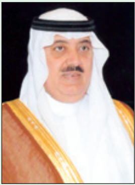
الأمير متعب بن عبدالله

وأشار إلى أن اهتمامه وبنائه فقد عودنا كل عام على وافته الخيرة ودعمه التواصل لبرامج وأنشطة الجمعية الخيرية لمساعدة الشباب على الزواج والتوجيه الأسري بجدة. وأشار إلى أن اهتمامه وبنائه فقد عودنا كل عام على وافته الخيرة ودعمه التواصل لبرامج وأنشطة الجمعية الخيرية لمساعدة الشباب على الزواج والتوجيه الأسري بجدة. وأشار إلى أن اهتمامه وبنائه فقد عودنا كل عام على وافته الخيرة ودعمه التواصل لبرامج وأنشطة الجمعية الخيرية لمساعدة الشباب على الزواج والتوجيه الأسري بجدة.