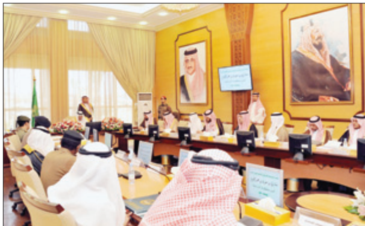
الأمير مشاري بن سعود يعقد اجتماعاً موسعاً مع المحافظين والمسؤولين في المنطقة

العقيد فهد الشريف، أنه إنفاذاً لهذا التوجيه فقد أنهت وزارة الحرس الوطني جميع الترتيبات اللازمة لاستضافة أسر الشهداء من منسوبي الحرس الوطني الراغبين في أداء مناسك الحج لهذا العام لكل أسرة، لأداء مناسك الحج بمشقة الله، وذلك بالتعاون مع وكالة الحرس الوطني بالقطاع الغربي. مما يُذكر أن هذا التوجيه يعد امتداداً لحرص صاحب السمو الملكي الأمير متعب بن عبدالله بن عبدالعزيز على أسر الشهداء من منسوبي الحرس الوطني ونوحيهم وعائلاتهم، والعمل على تأمين سبل الحياة الكريمة لهم.