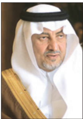
الأمير خالد الفيصل

الله، مؤكداً بأن الجمعية تعزّز بالتعاون المشترك بينها وبين رجال الأعمال والقطاع الخاص من أجل مساعدة الشباب والفتيات على الزواج، لاسيما أن العمل الاجتماعي هو عمل تكملي لا بد فيه من تكاتف الجهود لخدمة المجتمع وأفرادهم. وكانت الجمعية والتي تعد أول جمعية تقيم برنامج الزفاف الجماعي بالملكة قد استعرضت ورشة «حفلات الزفاف الجماعي بالملكة العربية السعودية.. رؤية مستقبلية» والتي نظمتها اللجنة التنسيقية لجمعية التنمية الأسرية بالملكة بالتعاون مع وزارة العمل والتنمية الاجتماعية، كما حصلت الجمعية من خلال حفلات الزفاف الجماعي على درع التميز للمشاريع الخيرية نظير جهودها وتميزها وتمكنها من رسم السعادة على شفاة الآلاف.