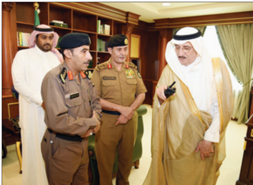
الأمير محمد بن ناصر يوجه كلمة لمنسوبي الاتصالات الأمنية عبر الجهاز الجديد

حضر التدشين مدير شرطة منطقة جازان اللواء ناصر بن صالح الدويهي ممثلاً عن الأمن العام بجازان وعددا من ضباط ومنسوبي أنظمة الاتصالات الأمنية بالمنطقة.