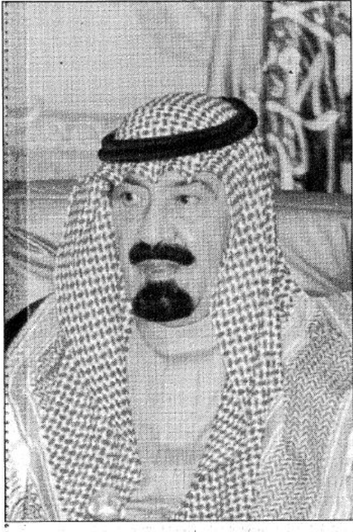
الأمير بدر بن عبد العزيز

مجموعة من التشكيلات والفعاليات التي تتضمن عروضاً رياضية ومعارض فنية ونشاطات مسرحية ومسابقات لمسار أبناء الحرس الوطني وللجانب الاعلامي استعدت اللجنة الاعلامية لتقديم عدد من البرامج الاعلامية التلفزيونية والاناعية بالنسبة للاضافة الى نشر عدد من التقارير الصحافية والتقنيات الاخبارية كما سيتم تنظيم زيارات لاعاد من الاعلاميين والكتبة لمرافق وحدات الحرس الوطني. والتقى الأمير بدر تصريحه قائلًا ان هذه البلاد وهي تسطر اسفار الاجتيازات للتربية وتتعاظم مع مرور الايام خصوصاً في هذا العهد من تاريخنا الجيد مع خادم الحرمين الشريفين الملك فهد بن عبد العزيز آل سعود حفظه الله، وصاحب السمو الملكي الأمير عبد الله بن عبد العزيز ولي العهد نائب رئيس مجلس الوزراء ورئيس الحرس الوطني، وصاحب السمو الملكي الأمير سلطان بن عبد العزيز نائب رئيس مجلس الوزراء وزير الدفاع والطيران. هذه البلاد تسطر اجتيازاتها ومكتسباتها ثمرة من غرس الإمام المؤسس الملك عبد العزيز بن عبد الرحمن آل سعود ووجهه الأبطال وجيله الجاهد رحمهم الله جميعاً فحين غرسوا بهمهم وعرقهم وفكرهم البنية الأولى لهذا الكيان العظيم الذي لا تزدهر الايام والسنة الا عظمت وبهائه وقوة وصلابة فمنااسبة مئوية التأسيس ليست الا ذكرى لنا نحن الاجيال الحاضرة واللاجيل القادمة لثمننا على هذا الكيان صانعين في العمل له والتضحية من اجله الى ابد الابدين.