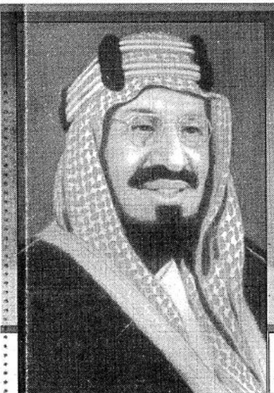
الأمير بدر بن عبد العزيز

ملحق يومي تصدره الجزيرة في ذكرى الاحتفال المئوي لتأسيس المملكة