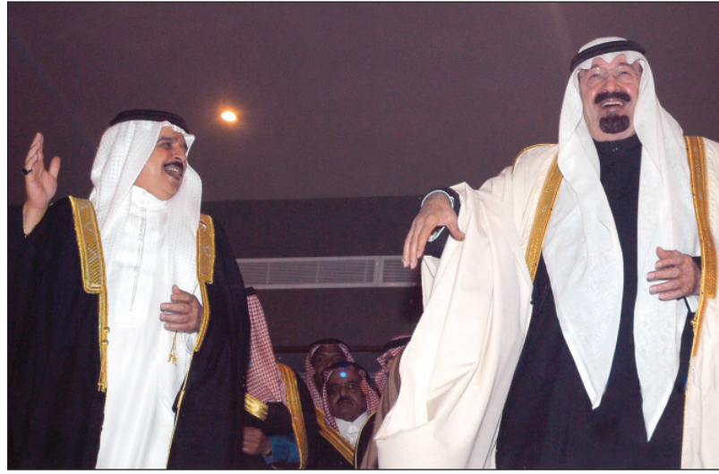
الملك عبدالله والملك حمد بن عيسى في حفل وأوبريت افتتاح الجنادرية ٢٣