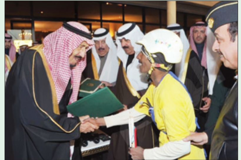
الملك سلمان يكرم الفائزين في ختام سباق الهجن الـ ٢٩

ينطلق اليوم سباق الهجن السنوي الكبير ضمن فعاليات المهرجان الوطني للتراث والثقافة "الجنادرية ٣٠" ويشترك فيه عدد من دول مجلس التعاون الخليجي والدول العربية.