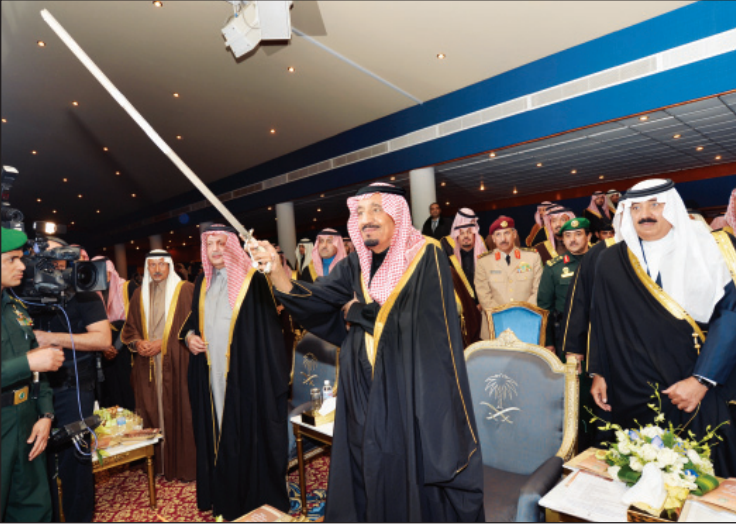
الملك سلمان في الجنادرية ٢٩ خلال رعايته الحفل نيابة عن أخيه الملك عبدالله -رحمه الله-