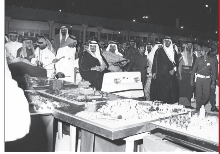
الملك فهد -رحمه الله- خلال جولته في مهرجان الجنادرية عام ١٤٠٦ هـ.