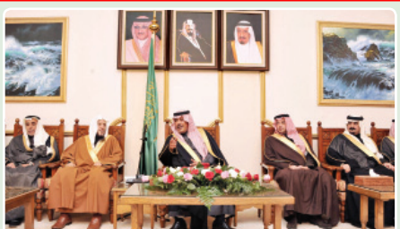
الباحة: إنجاز البنية الأساسية للمياه بتكلفة أربعة مليارات