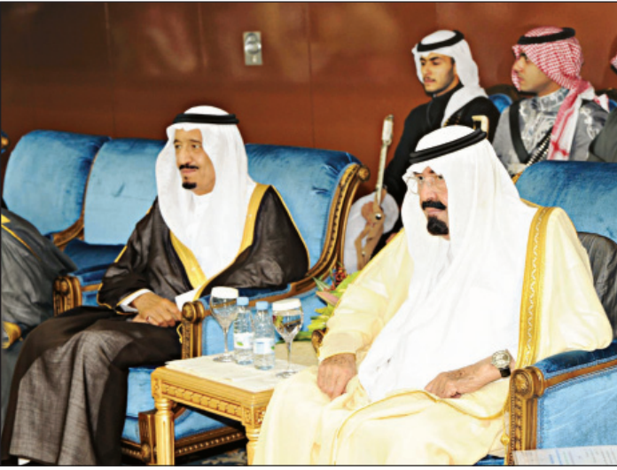
الملك عبدالله -رحمه الله- والملك سلمان -حفظه الله- خلال افتتاح الجنادرية ٢٦

الملك سلمان المؤرخ العالم بتراث المملكة والخير برجالاتها يؤكد المحافظة على قيم وأصالة منبع العروبة والإسلام