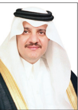
الأمير سعود بن نايف

■ أكد صاحب السمو الملكي الأمير سعود بن نايف بن عبدالعزيز أمير المنطقة الشرقية، أنه في كل عام يتابع الجميع المهرجان الوطني للتراث والثقافة بالجنادرية، هذه التظاهرة الثقافية التاريخية التي تجمع أبناء الوطن وتراثه وثقافته، مؤكداً سموه بأن المهرجان منذ انطلاقتها قبل أكثر من ثلاثة عقود، يعد رمزاً ثقافياً وتراثياً شامخاً، يعكس الحراك الحضاري بين ما عاشته المملكة في الماضي وما تعيشه الآن من تطور ونهضة في