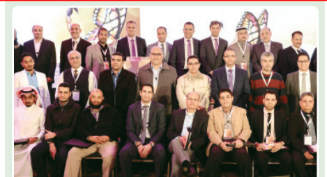
ملتقى طبي: تطور علاجي يحسن فرص الشفاء لمريضات سرطانات الثدي

The Longines Master Collection شركة الحصين التجارية AL-HUSSAINI TRADING CO. الرياض - جدة - الخبر - مكة المكرمة - المدينة المنورة - ينبع - الهفوف لزيد من المعلومات يرجى الاتصال على الهاتف ٤٤٤ ٢٤٤ ٨٠٠ أو على الرقم الموحد ٢٩٢٩٥ ٩٢٠٠