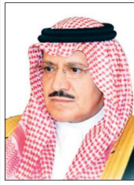
الأمير د. مشعل بن عبدالله

■ وأكد سموه أن تشريف خادم الحرمين الشريفين الملك سلمان بن عبدالعزيز آل سعود -حفظه الله- برعاية المهرجان يعكس اهتمام القيادة الحكيمة ورعايتها المستمرة لهذا المهرجان، مثنياً على الجهود المباركة التي يبذلها صاحب السمو الملكي الأمير متعب بن عبدالله بن عبدالعزيز وزير الحرس الوطني رئيس اللجنة العليا للمهرجان الوطني للتراث والثقافة، داعياً سموه الله أن يوفق القائمين على هذا المهرجان حيال تحقيق ما يتطلع إليه ولاة أمر هذه البلاد -حفظهم الله-، وأن يدعم على بلادنا أمنها ورخاها في ظل القيادة الحكيمة.