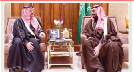
ولي ولي العهد يبحث مع وزير الدفاع القطري العلاقات والمسائل المشتركة