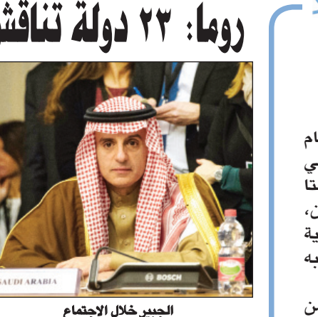
الجبير خلال الاجتماع

روما - وكالات بدأ المؤتمر الدولي للتحالف ضد تنظيم «داعش» الإرهابي أعماله أمس بمشاركة ٢٣ وزير خارجية إلى جانب ممثل عن الاتحاد الأوروبي. ورأس وفد المملكة وزير الخارجية عادل بن أحمد الجبير، ودشن المؤتمر بدايته بجلسة علنية تحدث فيها وزير الخارجية الإيطالي باولو جنتيلوني ووزير الخارجية الأمريكي جون كيري، وانعقدت جلسة نقاش عامة شارك فيها جميع الوزراء الحاضرين. وناقش المشاركون في الاجتماع التحديات والاستراتيجيات المستقبلية في مكافحة تنظيم داعش. (التفاصيل: ص ٢٠)