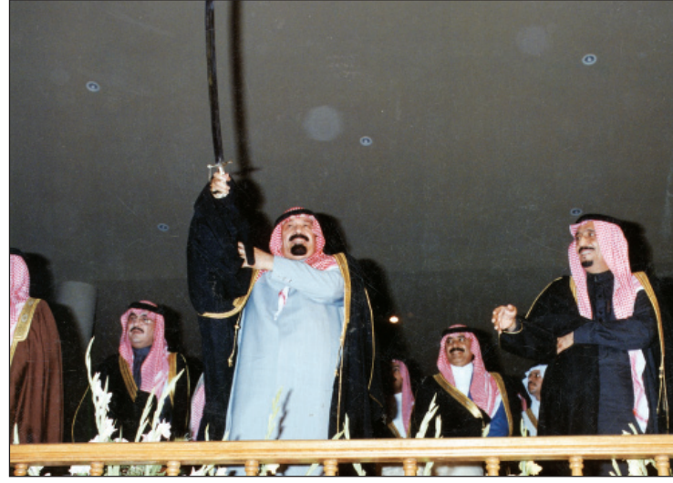
الملك عبدالله -رحمه الله- وبجانبه الملك سلمان في جنادرية عام ١٤١٥