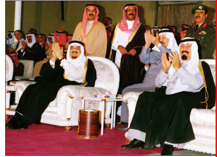
الملك فهد والملك عبدالله -رحمهما الله- في مهرجان ١٤٠٩

الملك سلمان بن عبدالعزيز -حفظه الله- هو الداعم الرئيسي لمشروعات وبرامج الحفاظ على التراث الوطني، والمهتم بنمو النشاط السياحي في المملكة، وكذلك المهتم بقضايا التراث منذ وقت طويل، وهو ما بدأ واضحاً في تطور النسيج العمراني والتراثي للعاصمة الرياض إبان توليه إمارتها على مدى خمسة عقود، خصوصاً عنايته بالمعالم التاريخية التي شهدت تكوين الدولة السعودية وتوحيد هذه البلاد على يد الملك المؤسس عبدالعزيز بن عبدالرحمن آل سعود -رحمه الله-.