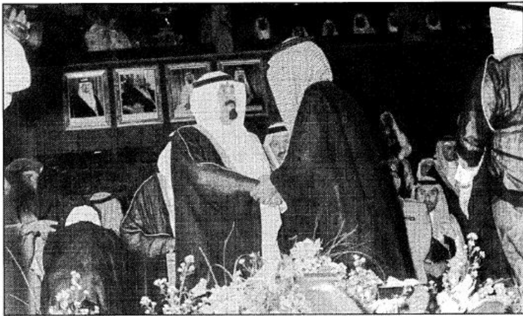
نائب خادم الحرمين الشريفين خلال رعايته احتفالات الطائف

مؤكداً أن افتتاح نائب خادم الحرمين الشريفين للمشـاريع السياحية بالطائف يمثل دعماً كبيراً للسياحة بالطاقف. كما تحدث صاحب السمو الملكي الأمير هذلول بن عبد العزيز وقال: ان تشريف سمو نائب خادم الحرمين الشريفين بالافتتاح من شأنه ان يعزز دورنا في تطوير قطاع السياحة بالملكة وبما يخدم المصالح السياحية للطاقف. وأضاف سمو الأمير هذلول بن عبد العزيز ان الغرض الاستراتيجي امام القطاع الخاص أصبحت مهبة حالياً للاستفادة من كل القومات السياحية للتوفرة بالطاقف لاقامة مشاريع سياحية مختلفة في كل المجالات وبما لا شك ان الطائف سوف تصبح مستقبلاً مقصداً سياحياً لا بد منه. أما صاحب السمو الأمير فيصل بن عبد الله بن محمد آل سعود وكيل الحرس الوطني بالمنطقة الغربية أوضح ان تشريف سمو نائب خادم الحرمين الشريفين بالافتتاح من شأنه ان يعزز دورنا في تطوير قطاع السياحة بالملكة وبما يخدم المصالح السياحية للطاقف. وأضاف سمو الأمير هذلول بن عبد العزيز ان تشريف سمو نائب خادم الحرمين الشريفين بالافتتاح من شأنه ان يعزز دورنا في تطوير قطاع السياحة بالملكة وبما يخدم المصالح السياحية للطاقف.