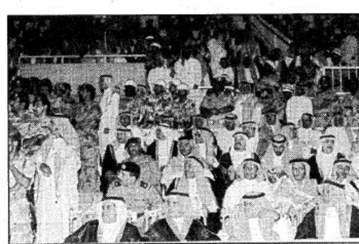
الوطنيين شاركوا بكثافة في احتفالات الطائف

اعرب مدير جوازات محافظة الطائف بالنيابة القدم هلال بن محمد الحارثي عن سعاداته بزيارة صاحب السمو الملكي الأمير عبد الله بن عبد العزيز نائب خادم الحرمين الشريفين وقال ان هذه الزيارة زيارة خير وبركة وكان لافتتاح نائب خادم الحرمين الشريفين للمشروعات السياحية دعماً للسياحة في محافظة الطائف. وهذه الزيارة ليست بغريبة على ولاه امرنا لانهم عودونا دائماً على هذه الزيارات وتفقد لحوال المواطنين والوقوف على احتياجاتهم عن كثب.