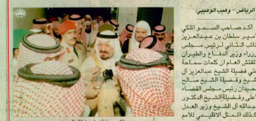
الأمير سلطان يتحدث للاعلاميين

وأوضح معاليه أن مسيرة القضاء في المملكة العربية السعودية، وباتكامل هذه المنظومة وتتابع صدور اللوائح التنفيذية لهذه الأنظمة استطاع القول وبثقة إن إجراءات التقاضي في الملكة قد وصلت إلى مرحلة تبسط على الاطمئنان وأنا شخصيا راض عما تحقق معرفتي ومعايشتي للجهود التي بذلت في إعداد هذه الأنظمة وصياغة نصوصها.