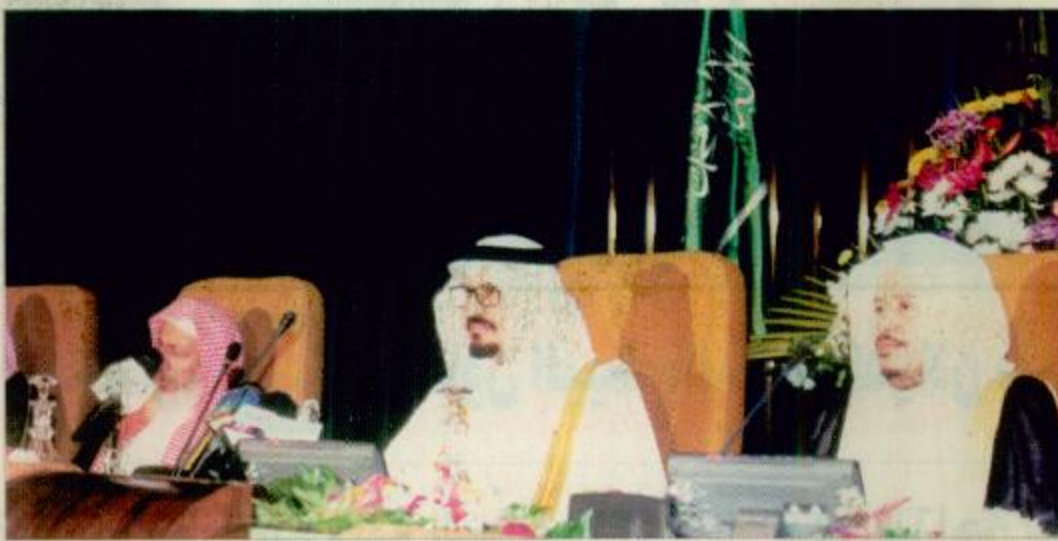
الأمير سلطان خلال رعايته للحفل

ثم ألقى الأستاذ أمين مكي مندي الممثل الاقليمي لمكتب المغوض السامي للامم المتحدة لحقوق الانسان في الدول العربية كلمة قال فيها إن انعقاد هذه الندوة تحت رعاية ولي العهد يؤكد إيلاء المملكة العربية السعودية، ملكا وحكومة وامة، الاهتمام والحرص التام على ارساء قيم العدالة وتعزيز وحماية كرامة الإنسان وفق ما نص عليه القرآن الكريم والشريعة الإسلامية أساس دستور المملكة، وما تضمنته العهود والمواثيق الدولية المعنية بحقوق الإنسان، والتي انضمت للملكة إلى الكثير منها في إطار سعيها المتواصل إلى الإصلاح النابع من الثوابت الإسلامية والقيم العربية.