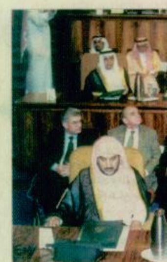
حضور مميز لحفل الانتخاب

وانصار الفضيلة وحملة كتاب العدل فادعو الله ان يعيد لهذه الربوع جديدا. وأشار الحيدان قائلا إن القضاء في الإسلام جاء بحكام قوية شديدة ولكن إذا علم أن أئمة أمن وأمان والسلاسة في الأنفس والأحوال والأعراض علمان أن اللطف الخبير ما أنزل كتابه إلا لتوفير السعادة للبشر ولحمايتهم، ولهذا فالقضاء الإسلامي عموما في جميع التاريخ قضاء نقي.