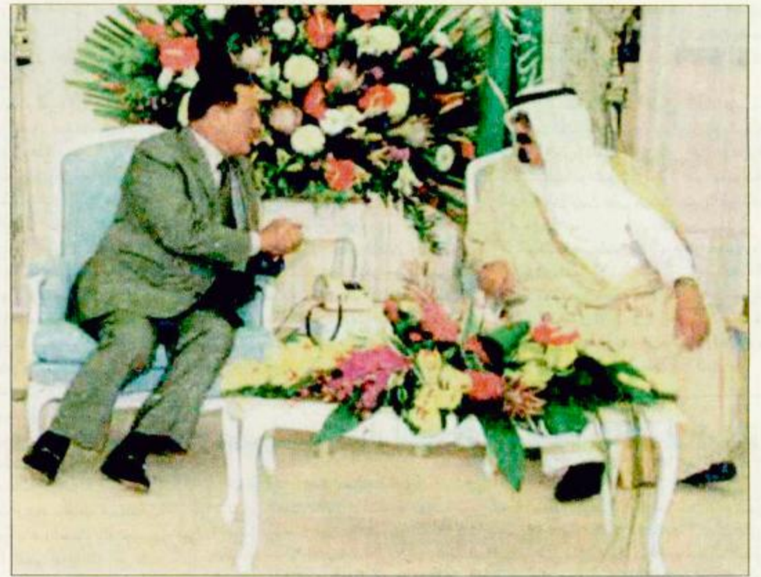
سمو ولي العهد والرئيس المصري