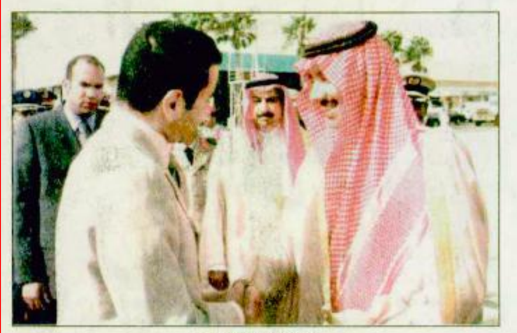
لقطة من المغادرة

الطائف - واس : غادر صاحب السمو الملكي الأمير رشيد الحسن الثاني محافظ الطائف أمس بعد ان رأس وفد المملكة المغربية في افتتاح المخيم الكشفي العربي الرابع والعشرين الذي تستضيفه المملكة في محافظة الطائف. وكان في وداع سموه في مطار الحوية صاحب السمو الملكي الأمير عبدالعزيز بن عبدالله بن عبدالعزيز وزير الأشغال العامة ومعالي محافظ الطائف فهد بن محمد وقائد منطقة الطائف العسكرية اللواء الركن عبدالله بن رشيد الشوخي ومدير شرطة محافظة الطائف اللواء عبدالحسن بن صالح السمييري ومدرب عن المراسم الملكية وعدد من المسؤولين.