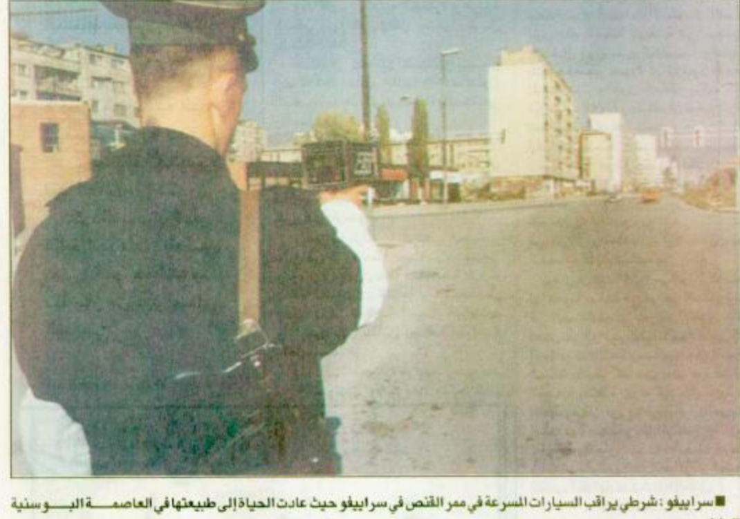
سراييفو: شرطى يراقب السيارات المسرعة في ممر القصف في سراييفو حيث عادت الحياة إلى طبيعتها في العاصمة البوسنية

الأمير سطاتم يكرم وزير داخلية جيبوتي وجه صاحب السمو الملكي الأمير سطاتم بن عبد العزيز نائب أمير منطقة الرياض الدعوة لحفل عشاء يقام في الساعة التاسعة مساءً اليوم بقصر الثقافة بحي السفارات تكريماً لمعالي ابريس حربي فارح وزير داخلية جيبوتي الذي يزور المملكة حالياً.