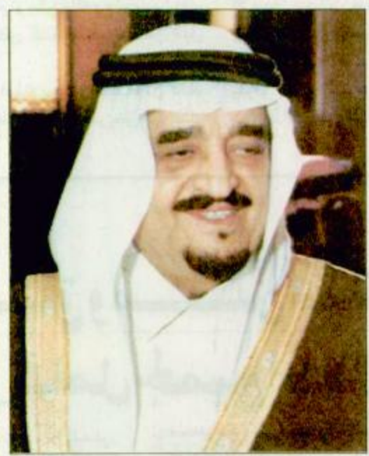
الأمير سلطان بن عبدالعزيز آل سعود

الغذاء العالمي ترتعز ومساهمات تقنية وعينية بلغت مليارات وخمسمائة وأحد وأربعين مليوناً وخمسمائة ألف ريال (1,541,500,000). وبلغت مساهمات المملكة في دعم برنامج الخليج العربي لدعم منظمة الأمم المتحدة حتى عام 1994م سبعة وستين وخمسين مليون ريال و787مليون ريال وتمثل هذه المساهمة حوالي 90% من موارد البرنامج الاجمالية وهو البرنامج الذي يقدم خدماته لاشد الدول فقرا في العالم وذلك من خلال المؤسسات الدولية.