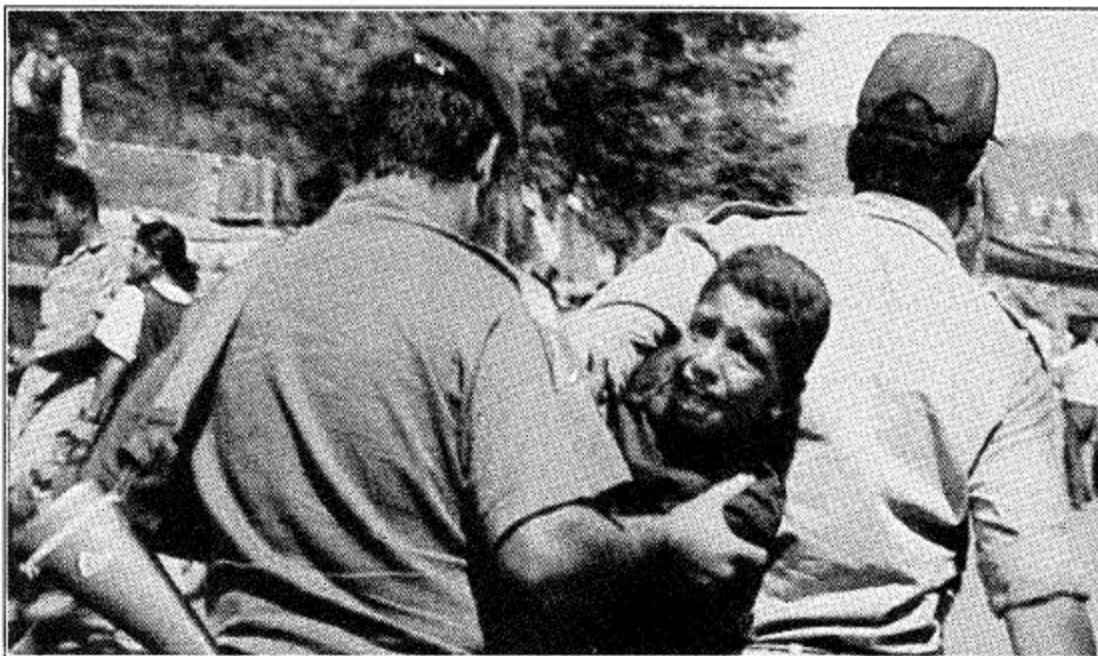
السلطات الأمريكية تعارض العفو في اعتقالها على الاطلاق الفلسطيني

فيينا من مراسل الجزيرة: دعت منظمة العفو الدولية اسرائيل والسلطة الفلسطينية الى ضرورة احترام حقوق الانسان ووضع هذه الحقوق في سلم الأولويات في كل السياسات العامة والاتفاقيات الموقعة او التي ستعقد بينهما في المستقبل.