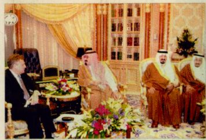
سمو ولي العهد لدى اجتماعه مع الرئيس البولندي - واس