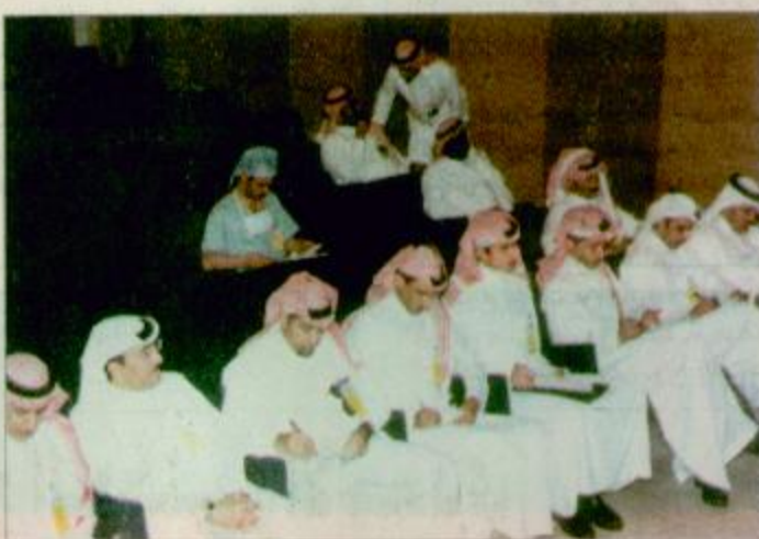
متابعة إعلامية لمرحل العملية

وفي تمام الساعة الخامسة وخمس دقائق بتوقيت المملكة أعلن الدكتور عبدالله الربيعه فصل التوأمتين الغيبيتين بشكل كامل.