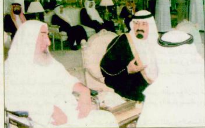
○ سمو ولي العهد لدى استقباله الشيخ ياسين

منى - واس: استقبل صاحب السمو الملكي الأمير عبد الله بن عبدالعزيز ولي العهد ونائب رئيس مجلس الوزراء ورئيس الحرس الوطني في منى أمس مؤسس حركة حماس الشيخ أحمد ياسين الذي يطلب العلاج في مستشفى الملك خالد بجدة التابع للحرس الوطني ويؤدى الشيخ أحمد ياسين حج هذا العام تحت إشراف طبي بقيقة، ص: ٢٠.