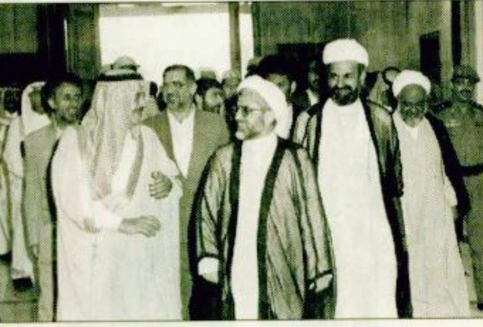
○ سمو الأمير نايف يرحب بوزير الداخلية الإيراني عبد الله نوري

مكة المكرمة - واس: أقام صاحب السمو الملكي الأمير نايف بن عبدالعزيز وزير الداخلية أمس حفل عشاء تكريمياً لمعالي وزير الداخلية في الجمهورية الإسلامية الإيرانية عبد الله نوري.. وحضر الحفل صاحب السمو الملكي الأمير أحمد بن عبدالعزيز نائب وزير الداخلية وصاحب السمو الملكي الأمير محمد بن سعد بن عبدالعزيز مستشار سمو وزير الداخلية وصاحب السمو الملكي الأمير محمد بن نايف بن عبدالعزيز ومعالي وكيل وزارة الداخلية للشؤون بقيقة، ص: ٢٠.