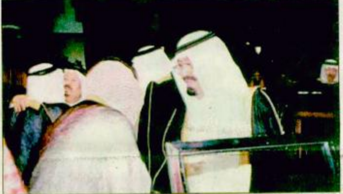
○ سمو ولي العهد يغادر منى إلى جدة

منى - جدة - واس: يحفظ الله ورعايته غادر صاحب السمو الملكي الأمير عبد الله بن عبدالعزيز ولي العهد نائب رئيس مجلس الوزراء ورئيس الحرس الوطني منى مساء أمس متوجهاً إلى جدة بعد أن أشرف مع خادم الحرمين الشريفين الملك فهد بن عبدالعزيز آل سعود حفلة الله على راحة حجاج بيت الله الحرام والأطمئنان عن قرب على مراحل الخطة العامة لتقلات الحجاج في المشاعر بقيقة، ص: ٢٠.