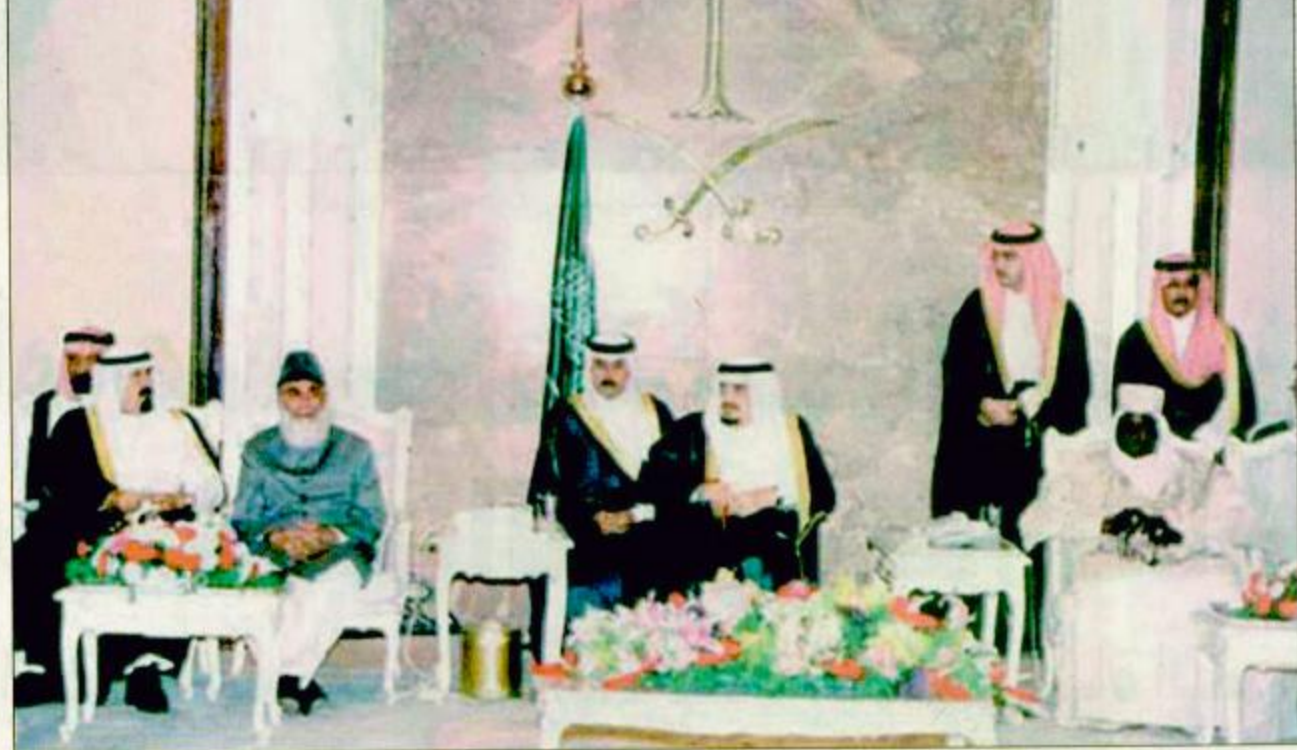
○ خادم الحرمين الشريفين يتوسط الرئيسين الباكستاني والجامبي وسمو ولي العهد في الحفل السنوي للشخصيات الإسلامية

منى - واس : قال خادم الحرمين الشريفين الملك فهد بن عبدالعزيز آل سعود وصاحب السمو الملكي الأمير عبد الله بن عبد العزيز ولي العهد ونائب رئيس مجلس الوزراء ورئيس الحرس الوطني: إن المملكة العربية السعودية التي تعتز كل الاعتزاز بخدمتها للإسلام والمسلمين حريصة أشد الحرص على تطبيق الشريعة الإسلامية نصاً وروحاً لاتأخذها في ذلك لومة لائم وسجل - حفظهما الله - في كلمة وجهها إلى حجاج بيت الله الحرام لوسم حج هذا العام 1418 - 1998م تشرفهما في خدمة الحج والحجاج والمعتمرين والزائرين وفي مقدمتها خدمة الحرمين الشريفين وتسخير الإمكانيات والمناطق لتوسعتها والعمل على صيانتها لتكون على النحو والمظهر اللائق بهما.. وأكد الملك الفهدى وسمو ولي عهده الأمين لجميع حجاج بيت الله الحرام وللمسلمين كافة أن الحرمين الشريفين سيقبلان إن شاء الله محل حرصهما واهتمامهما وستواصل