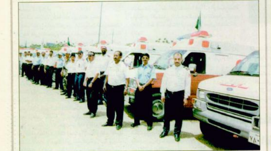
○ أفراد وسيارات إسعاف جديدة ومجهزة بدم الوير في مكة المكرمة

منى: صلاح مطارش جسدت جمعية الهلال الأحمر السعودي أكثر من 1900 فرد ما بين طبيب ومسعف وفني وهيئات 119 مركزة للإسعافات بمكة المكرمة وللشاعر المقدسة وجهزت 325 سيارة إسعاف بأحدث الأجهزة الاسعافية مثل أجهزة الإنعاش القلبي والرئوي وتثبيت الكسور وكذلك استخدام الدراجات النارية للوصول إلى الحالات في الأماكن الازدحام.