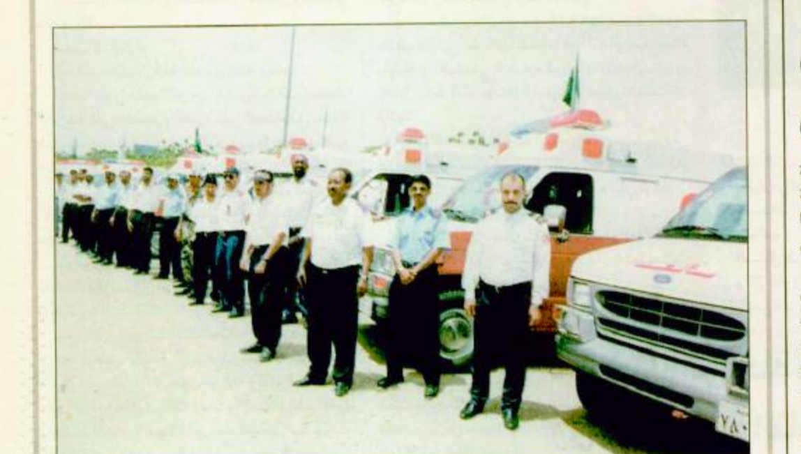
○ أفراد وسيارات إسعاف جديدة ومجهزة بدقم الوبر في مكة المكرمة

منى: صلاح مغازل: جندت جمعية الهلال الأحمر السعودي أكثر من 1900 فرد ما بين طبيب ومسعف وفني وهيئات 119 مركزة للإسعافات بمكة المكرمة وللشاعر المقدسة وجهزت 325 سيارة إسعاف بأحدث الأجهزة الاسعافية مثل أجهزة الإنعاش القلبي والرئوي وتثبيت الكسور وكذلك استخدام الدراجات النارية للوصول إلى الحالات في الأماكن الازدحام. الصورة: مركز الاستاد والطوارئ لجمعية الهلال الأحمر السعودي بدقم الوبر المزود بأحدث السيارات الاسعافية.