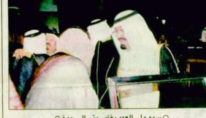
○ سمو ولي العهد يغادر منى إلى جدة

منى-جدة-واس: يحفظ الله ورعايته غادر صاحب السمو الملكي الأمير عبدالله بن عبدالعزيز ولي العهد نائب رئيس مجلس الوزراء ورئيس الحرس الوطني منى مساء أمس متوجهاً إلى جدة بعد أن أشرف مع خادم الحرمين الشريفين الملك فهد بن عبدالعزيز آل سعود حفلة الله على راحة حجاج بيت الله الحرام والأطمئنان عن قرب على مراحل الخطة العامة لتقلات الحجاج في المشاعر بقيقه ص: ٢٠