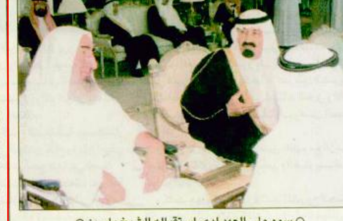
○ سمو ولي العهد لدى استقباله الشيخ ياسين

منى - واس: استقبل صاحب السمو الملكي الأمير عبدالله بن عبدالعزيز ولي العهد ونائب رئيس مجلس الوزراء ورئيس الحرس الوطني في منى أمس مؤسس حركة حماس الشيخ أحمد ياسين الذي يلقى العلاج في مستشفى الملك خالد بجدة التابع للحرس الوطني ويؤدي الشيخ أحمد ياسين حج هذا العام تحت إشراف طبي بقيقه ص: ٢٠