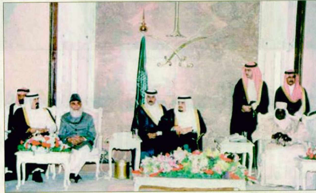
○ خادم الحرمين الشريفين يتوسط الرئيسين الباكستاني والجامبي وسمو ولي العهد في الحفل السنوي للشخصيات الإسلامية