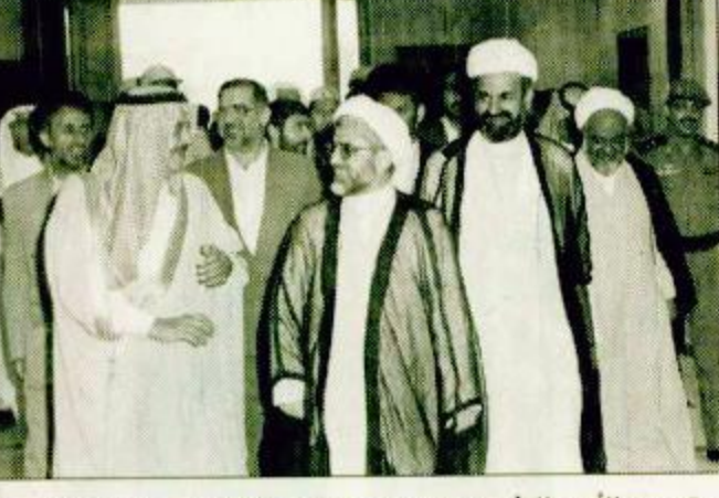
○ سمو الأمير نايف يرحب بوزير الداخلية الإيراني عبد الله نوري

مكة المكرمة - واس: أقام صاحب السمو الملكي الأمير نايف بن عبدالعزيز وزير الداخلية أمس حفل عشاء تكريمياً لمعالي وزير الداخلية في الجمهورية الإسلامية الإيرانية عبدالله نوري. وحضر الحفل صاحب السمو الملكي الأمير أحمد بن عبدالعزيز نائب وزير الداخلية وصاحب السمو الملكي الأمير محمد بن سعد بن عبدالعزيز مستشار سمو وزير الداخلية وصاحب السمو الملكي الأمير محمد بن نايف بن عبدالعزيز ومعالي وكيل وزارة الداخلية للشؤون بقيقه ص: ٢٠