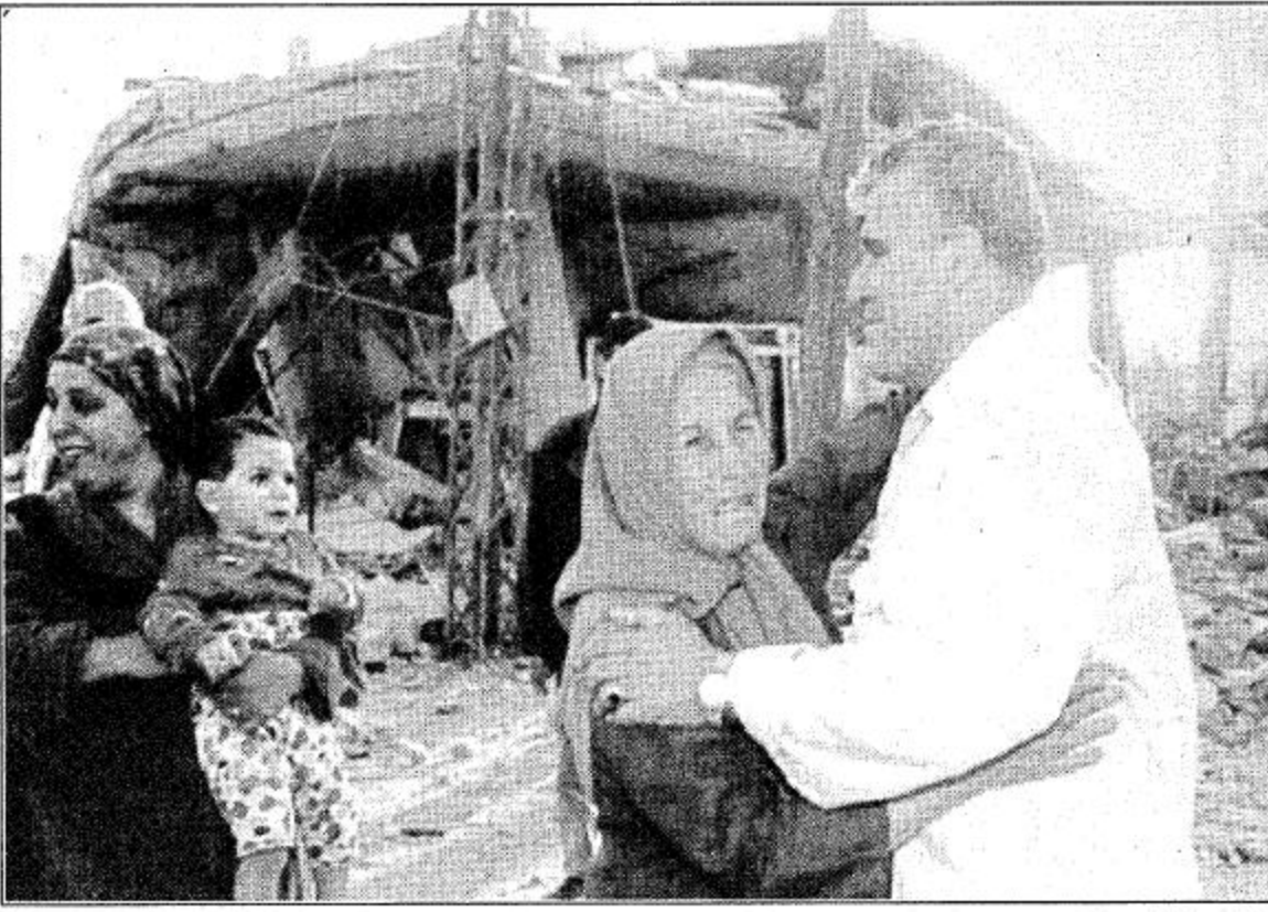
كليل - لبنان - أ ب:

أحد اللاجئين اللبنانيين يهدى من روع شقيقته التي أصابها الهم لذي رؤية الدمار الذي حل ببلدتها بقرية كليل بالجنوب اللبناني، ما يقرب من نصف مليون لاجئ لبناني يتوافدون إلى قراهم ومدنهم بالجنوب اللبناني بعد سريان وقف إطلاق النار.