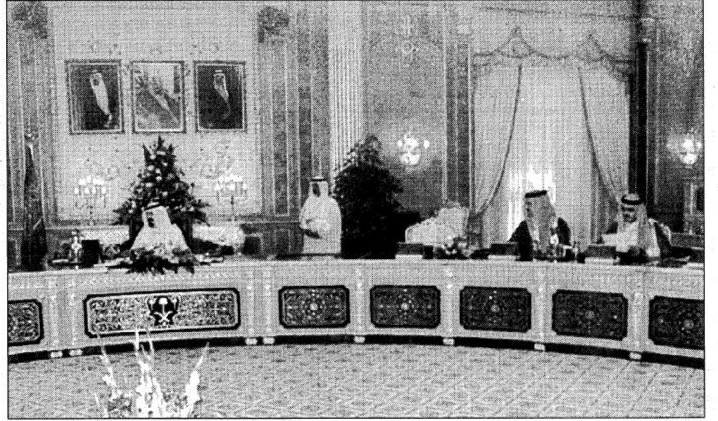
لحقتان من جلسة مجلس الوزراء التي ترأسها سمو ولي العهد

١٩ بعد الفقرة ٩ بالنص التالي، ٩٠ بناء على اقتراح مجلس الإدارة يجوز للمؤتمر بغالبية ثلثي أصوات الناخبين الحاضرين للقرنين ان يلغي أي اتفاقية معتمدة وفقاً لأحكام هذه اللوائح اذا تبين ان الاتفاقية فحقت غايتها أو انها لم تحوّل تقدم أي اسهام يفيد في تحقيق أهداف المنظمة. وقد أعد مشروع مرسوم ملكي بذلك صيغته مرفقة بالقرار. رابعاً، بعد الاطلاع على العمارة الواردة من ديوان رئاسة مجلس الوزراء الشتملة على برقية معالي وزير المالية والاقتصاد الوطني. وبعد الاطلاع على توصية اللجنة العامة لمجلس الوزراء قرر المجلس، الوافقة على إعادة تشكيل مجلس إدارة صندوق التنمية الصناعية السعودي لمدة ثلاث سنوات اعتباراً من تاريخ نفاذ هذا القرار. على النحو التالي: ١ - ممثل وزير المالية والاقتصاد الوطني ونائبه. ٢ - ممثل وزارة الصناعة والكهرباء عضواً. ٣ - ممثل وزارة التجارة عضواً. ٤ - ممثل وزارة التخطيط عضواً. ٥ - ممثل المؤسسة النقد العربي السعودي عضواً. مع التقيد بما ورد في الرسوم الملكي رقم / م / ٥٤ وتاريخ ١٤٠٧/١٠/١٩هـ.