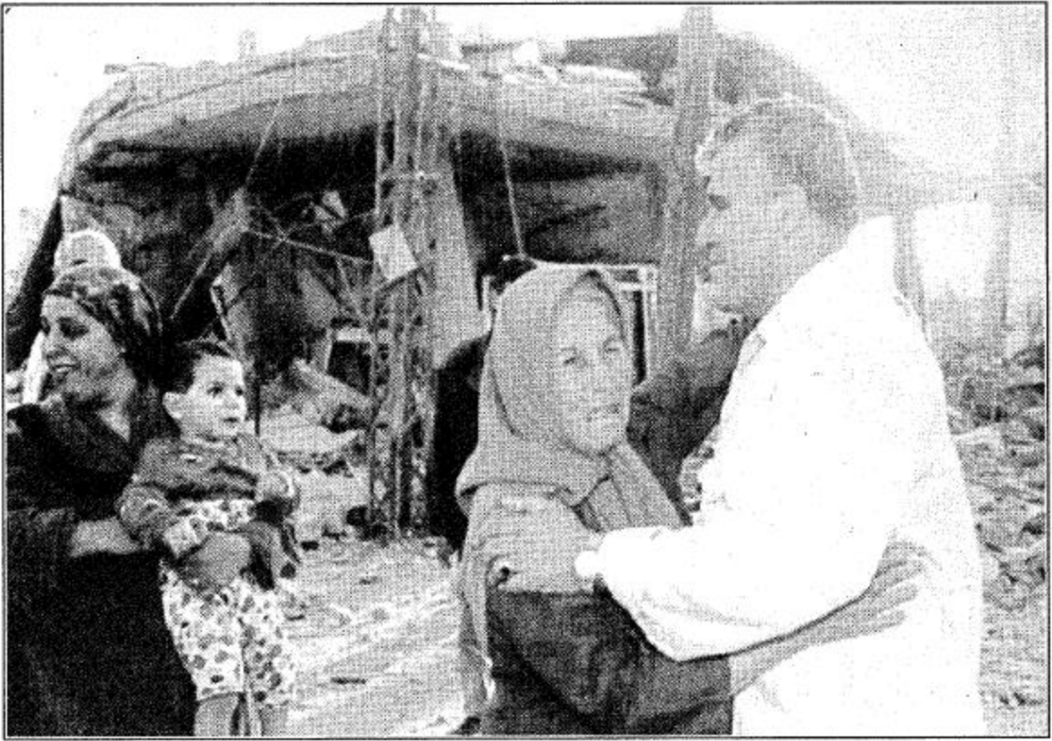
كليل - لبنان - أ ب:

اللاجئون اللبنانيون يتزاحمون بسياراتهم على الطريق السريع قرب صيدا عائدين الى قراهم بالجنوب اللبناني بعد سريان اتفاقية وقف اطلاق النار ما بين اسرائيل وما يسمى بحزب الله.