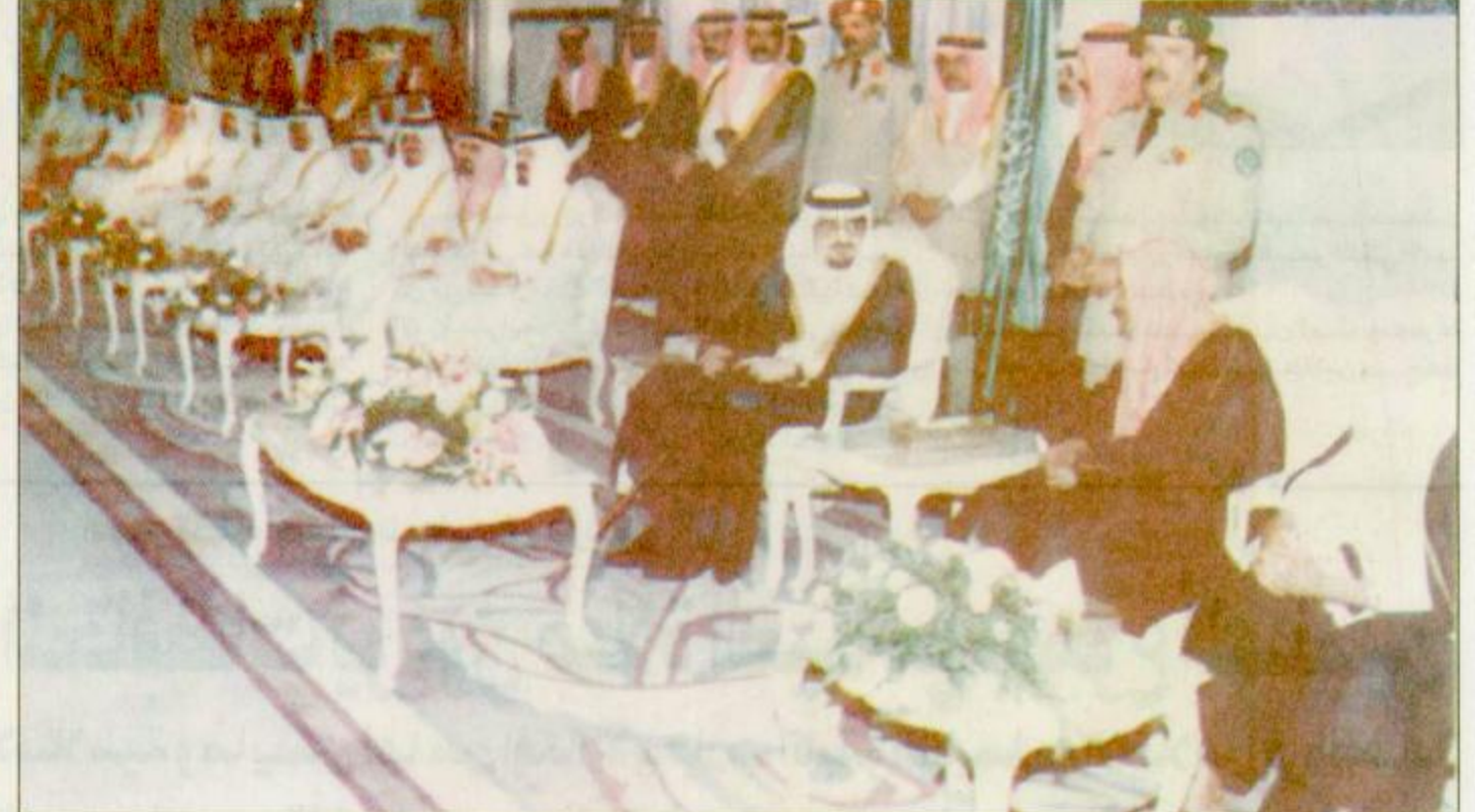
عادم الحرمين يستقبل الأمراء والعلماء والوزراء.