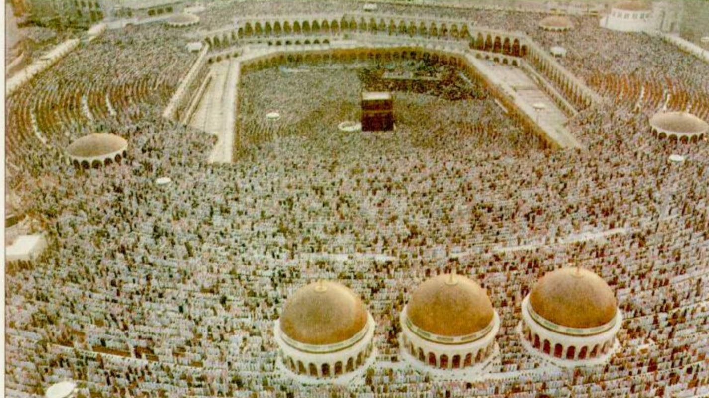
أكثر من مليون حاج يؤدون صلاة العيد في المسجد الحرام.