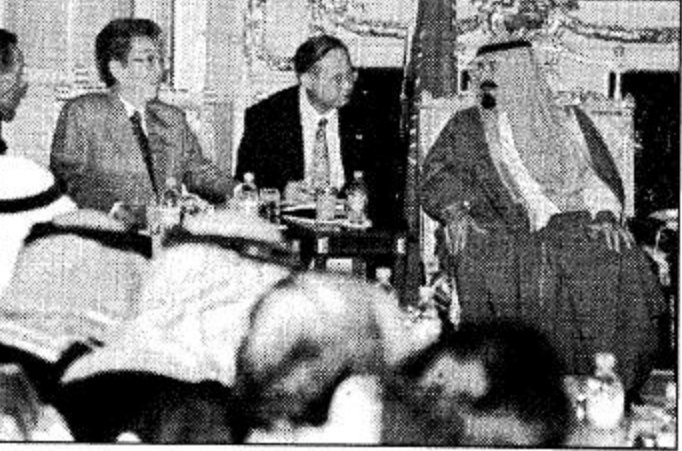
الأمير عبد الله بن خالد آل سعود مع ولي العهد الياباني في اجتماع بالصرح الامبراطوري في طوكيو.