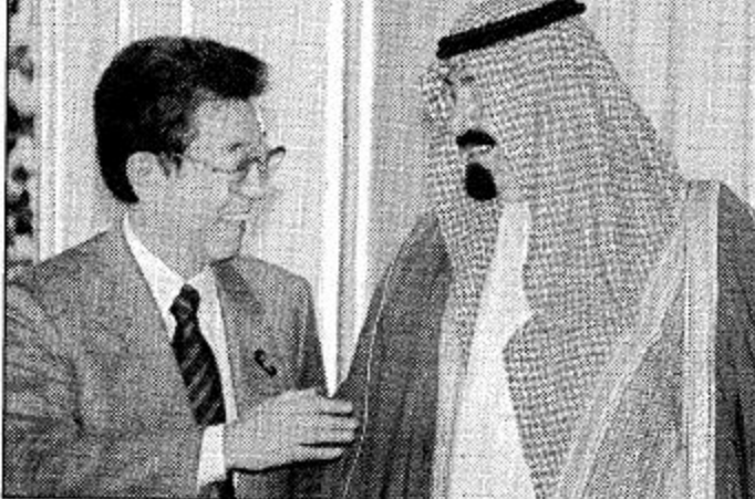
الأمير عبد الله بن خالد آل سعود مع ولي العهد الياباني في اجتماع بالصرح الامبراطوري في طوكيو.