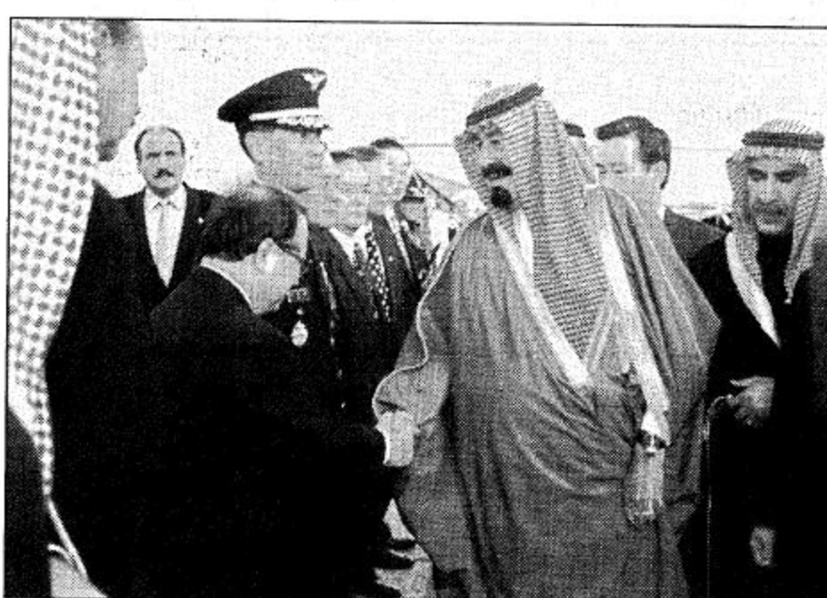
الأمير عبد الله بن خالد آل سعود مع ولي العهد الياباني في اجتماع بالصرح الامبراطوري في طوكيو.