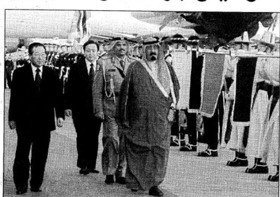
الأمير عبد الله بن خالد آل سعود مع ولي العهد الياباني في اجتماع بالصرح الامبراطوري في طوكيو.