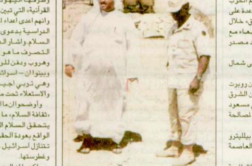
معسكر النوبة - الكويت: جندي امريكي واحد المتضاد للصواريخ باللقا عدة العسكرية الامريكية في معسكر النوبة امس الخميس «١٠.٠.٢٠» البقية «ص 21»

ومن جهة اخرى قال مسؤولو وزارة الخارجية ان روبرت بيللنترو مساعد وزير الخارجية الامريكي لشؤون الشرق الاوسط حيث زعم الحزب الديمقراطي الكردستاني مسعود البرزاني على التحلي عن تحالفه مع بغداد والسعي لصالح جماعة كردية منافسة. وقال نيكولاس بيونز المتحدث باسم الوزارة ان بيللنترو اجتمع مع البرزاني لعدة ساعات في مكان سري بالعاصمة التركية انقرة امس الاول الأربعاء. وقال بيونز: «اثار السفير بيللنتري، كثيراً من المسائل المهمة التي اثارها قتل الولايات المتحدة منذ تفجر هذه الأزمة ولها صلة بموقف الجماعة الكردية الرئيسيتين والنزاع بينهما. وأضاف قوله: «لأنرى ان الاكراه العراقيين يمكن ان يربحوا على الاجل الطويل من الارتباط مع صدام» البقية «ص 21»