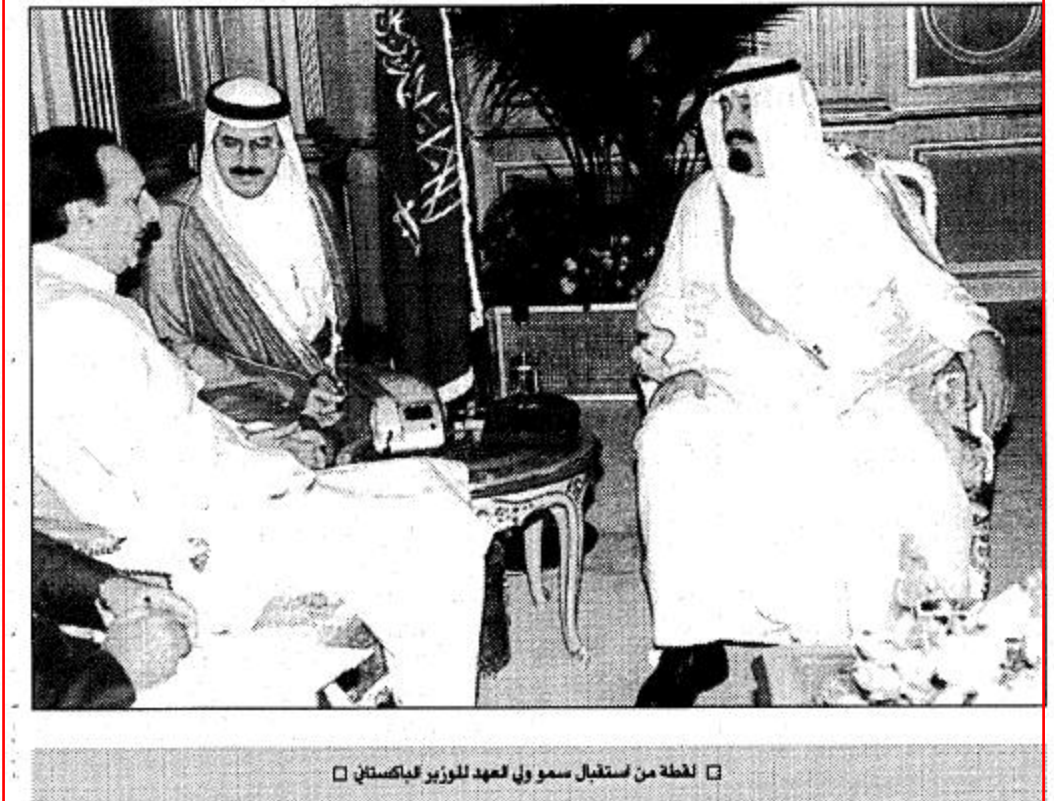
لحظة من استقبال سمو ولي العهد لوزير دبي دبيستان