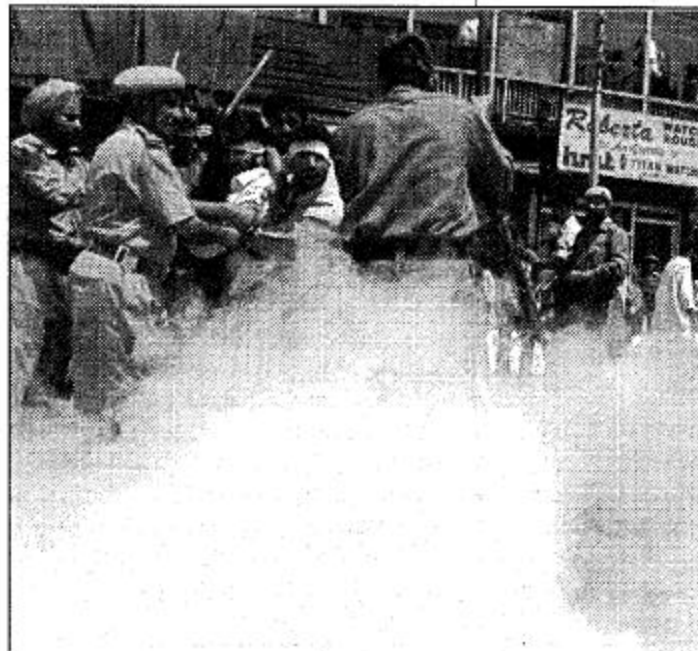
ميراجار، كشمير: ا.ف.ب. القوات الهندية في كشمير تقضي على زعيم شعبي شاه «الربع من اليسار» ومعه بعض اعوانه عقب قيامهم بتظاهرة في ضواحي سرينجارس احتجاجا على اعمال القمع والتعذيب التي ترتكبها السلطات الهندية في الجزء المحتل من كشمير. - جنوبياس استخدمت عندها من قنابل الدخان في محاولة لفض التظاهرة.

نيودلهي، ا.ف.ب. استبعد رئيس الوزراء الهندي بيهاري فاجباي اجراء محادثات مع باكستان حول تحويل خط الحدود الذي يفصل بين المناطق التابعة للهند وباكستان بالشميل كشمير الى خط الحدود الدولية بين البلدين كوسيلة لحل قضية كشمير. وقال اتال بيهاري فاجباي امام مجلس الشعب الهندي (النيوز) ان قليم كشمير كقارلا ينتمي الى الهند. مشيرا الى ان البرلمان اسدق بالفعل قرارا عام 1954 يؤكد ان كشمير بعد جزاء لا يتجزأ من البلاد. وأوضح ان حكومته مستعدة لاجراء محادثات مع باكستان لتتناول جميع القضايا الثنائية بما فيها قضية كشمير خاصة ما يتعلق بقيام باكستان بمساندة الأنشطة الارهابية عبر الحدود في كشمير وغيرها من الولايات الهندية. وأشار الى انه سيغادر رئيس الوزراء الباكستاني نواز شريف لثائه اجتماعا القادم بكراچيو على هامش قمة رابطة التعاون الاقليمي لجنوب اسيا (سارك) بقلق نيودلهي اراه ما سماه دعم باكستان للمتسللين والسليحين بقليم كشمير. ودعا رئيس الوزراء الهندي باكستان الى الوفاق على توقيع معاهدة بين البلدين حول عدم توجيه التهمة للبلدان الاخرى. وقال انه سيتفقد هذه المسألة الثاني اجتماعه مع نواز شريف بكراچيو في اواخر الشهر الحالي. وأضاف ان مراقبة باكستان على هذه المسألة تعد خطرة اضافية على طرفي بقاء الثقة بين البلدين. مؤكدا ان الهند لا تريد الحرب لما تسعى لاقامة علاقات ودية وطيبة مع باكستان.