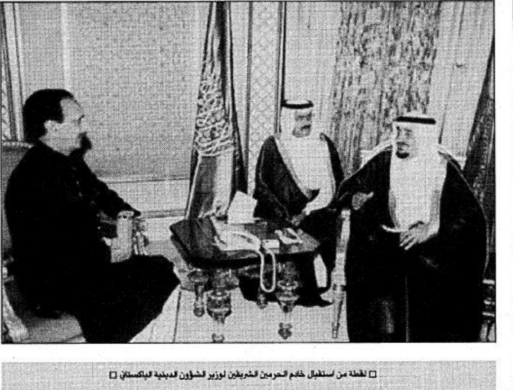
لحظة من استقبال خادم الحرمين الشريفين لوزير لشؤون مدينة دبي دبيستان

وشارك في إن التوزيع سيتم بمكتب اشتراكات الدلم خلال فترة الدوام الرسمي داعياً المتقدمين إلى مراجعة مكتب الاشتراكات لاستلام أرقامهم مصطحبين معهم الأوراق الثبوتية.