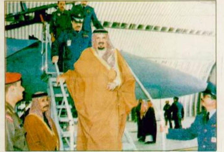
الشريفيين وسمو ولي عهده الأمين وسمو النائب الثاني.