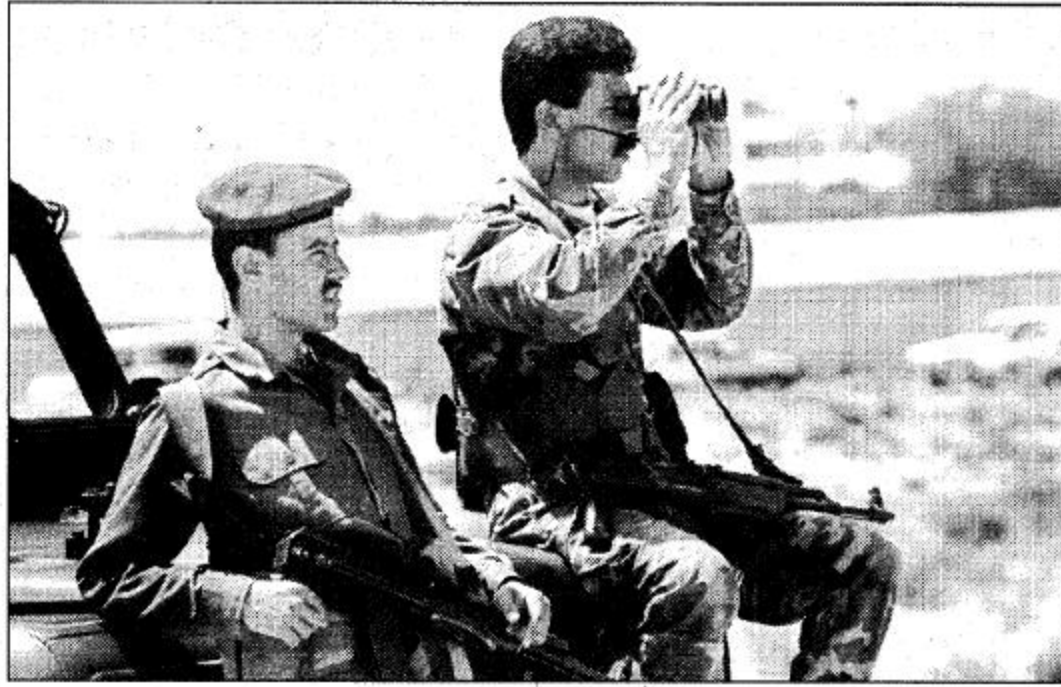
غزة - رويترز: جندي فلسطيني يراقب بنظارة الجنود الإسرائيليون حيث يقوم الفلسطينيون بالصلاة في الأرض التي صادرتها إسرائيل بالقرب من مستوطنة موزاج اليهودية في وادي غزوة غرب غزة.

القاهرة ١٨ ش. أ. أكت دولة فلسطين استمرار الجهود والاتصالات مع دول العالم للعمل على تنفيذ قرارات الشرعية الدولية وبخاصة قرار مجلس الأمن رقم ٤٦٥ / ١٩٨٠ الذي اعتبر المستوطنات الإسرائيلية في الأراضي المحتلة غير شرعية. وعلمت دولة فلسطين في مذكرة تلقها الأمانة العامة لجامعة الدول العربية بتفكيك المستوطنات القائمة، ودعت المجتمع الدولي وخاصة الولايات المتحدة، دول الاتحاد الأوروبي والولايات المتحدة والصناديق الدولية للتحرك على عدم تقديم مساعدات اقتصادية ومالية تستخدمها إسرائيل في تنفيذ مشاريع استعمارية إسرائيلية في الأراضي العربية المحتلة. وأشارت المذكرة إلى الممارسات القمعية الإسرائيلية ضد أبناء الشعب العربي الفلسطيني ودعت إلى ضرورة فضح هذه الممارسات أمام الرأي العام العالمي والتصدي لها بكافة السبل والطرق. كما أشارت إلى الإجراءات التي اتخذتها منظمة التحرير الفلسطينية لتشكيل لجان شعبية محلية للدفاع عن الأراضي الفلسطينية في مواجهة الاعتداءات الإسرائيلية. وتندت المذكرة بقرار الحكومة الإسرائيلية بتوسيع المستوطنات اليهودية في الضفة الغربية ووصفته بأنه قرار خاطئ ويتعارض مع اتفاقات السلام البرية وأشار إلى أن عدد المستوطنات الإسرائيلية في الضفة الغربية والقدس وغزة بلغ حتى عام ٩٨ ملياً لاحت الإحصاءات ٢٠ مستوطنة تتوزع على المحافظات الفلسطينية المختلفة. أوضحت المذكرة أن ٧٣ مستوطنة توجد في شمال الضفة الغربية، وأوروبية ودولية.