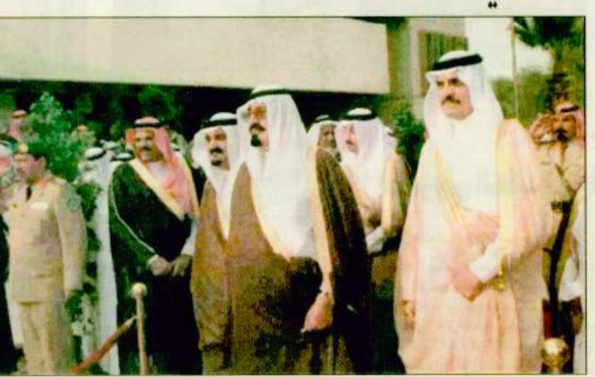
سمو ولي العهد لدى تشريفه لحفل اطلاق الأحساء تلقاهما سمو ولي العهد من رئيسي اكسون وموبيل عرضان أمريكيان للاستثمار في مجال البترول والغاز في المملكة □ الدمام: واس - استقبال صاحب السمو الملكي الأمير عبدالله بن عبدالعزيز ولي العهد ونائب رئيس مجلس الوزراء ورئيس الحرس الوطني في مكتب سموه بقصر الخليفة بالدمام أمس رئيس مجلس إدارة شركة اكسون الأمريكية للبترول في ريمون ورئيس شركة موبيل الأمريكية للبترول لوتشو نوتو اللذين قدما لسمو ولي العهد عرضاً أولياً عن البقية ص ٢٩

□ الأحساء: عبدالله اللحج - عبدالله المحسن السعودون - واس: قام صاحب السمو الملكي الأمير عبدالله بن عبدالعزيز ولي العهد ونائب رئيس مجلس الوزراء ورئيس الحرس الوطني بوضع حجر الأساس لمصنع الأقمشة التابع للشركة السعودية اليابانية لصناعة الأقمشة إحدى شركات الأحساء للتنمية.