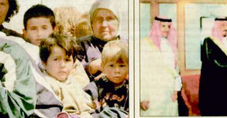
الأمير سلمان لدى زيارته لحاكم هونج كونج □ (واس) صاحب السمو الملكي الأمير عبدالله بن عبدالعزيز ولي العهد إلى الصين في أكتوبر الماضي. هذا وأوضح السفير الصيني أن سمو الأمير

حاكم هونج كونج استقبال سموه لدى زيارته الخاصة للجزيرة الأمير سلمان يبدأ اليوم زيارة رسمية للصين السفير الصيني لـ «الجزيرة»: الزيارة هامة لدعم العلاقات وتعزيز التعاون