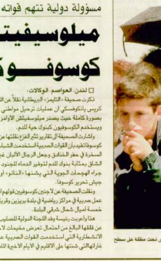
مورينا - ألبانيا: اب ب لاجئون كوسوفيون يظنون انفسهم حرارة الشمس تحت مظلة على سطح شاحنة أثناء وصولهم الى نقطة تفحص مورينا الحدودية بالقرب من كوتيز.

□ لندن: العواصم - الوكالات: ذكرت صحيفة «التايمز» البريطانية نقلاً عن المتحدث باسم المفوضية كريس يانكوفسكي أن عمليات ترحيل مواطني كوسوفا قد استؤنفت بصورة كاملة حيث يصدر ميلوسيفيتش الأوامر بعملية تطهير عرقي ويستهدف الكوسوفيين كبنوك حياة للدم.