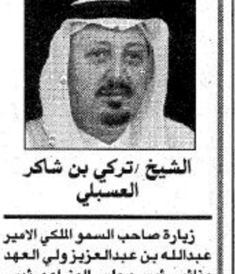
الشيخ تركي بن شاكر العسيلي

زيارة صاحب السمو الملكي الأمير عبدالله بن عبدالعزيز ولي العهد ونائب رئيس مجلس الوزراء ورئيس الحرس الوطني رعاة الله لمنطقة عسير، زيارة تعكس حرص ولاة الأمر على تلمس احتياجات المواطنين من احتياجاتهم وقرى المنطقة وتلبية احتياجاتها ومتطلبات مواطنيها فلا يكادون يصلون منطقة أو محافظة حتى يفتتحوا مشروعا أو تجهيزه أو وضع حجر أساس لمشروع آخر وما المشاريع التي وضع حجر أساسها قبل أيام صاحب السمو الملكي الأمير سلطان بن عبدالعزيز والشاريع التي يفتتحها صاحب السمو الملكي الأمير عبدالله بن عبدالعزيز إلا دالة واضحة على الخير العميم الذي يصبغ كل زيارة. ان كل مواطن في منطقة عسير يتطلع ويتربط بهذه الزيارة اليمونة، وأنه لشرف عظيم لرجال الحجر ان تلمظهم الزيارة الكريمة لسمو أميرهم والوفاء خالها عن مشاعر الحب والوفاء والولاء لحكومتنا الرشيدة بقيادة خادم الحرمين الشريفين. ولا يفتوت في هذه المناسبة السعيدة ان أشيد بالثابثة الحليمة لصاحب السمو الملكي الأمير خالد الفيصل أمير منطقة عسير لمشاريع هذه المحافظة وغيرها من محافظات منطقة عسير حتى وصلت إلى ما وصلت إليه. كما أشيد بجهود أصحاب السمو الأمراء والعالي الوزراء كل في مجاله والمسؤولين في القطاعات الحكومية ما يبذلونه من مجهودات جبارة لتقديم أفضل الخدمات لأبناء هذه المحافظة وفقاً لتوجيهات قيادتنا الرشيدة بقيادة باني عهد الرخاء والعطاء والنهضة الحديثة مولاي خادم الحرمين الشريفين الملك فهد بن عبدالعزيز حفظه الله وادمه في عمره. وولي عهد الامين صاحب السمو الملكي الأمير عبدالله بن عبدالعزيز وصاحب السمو الملكي الأمير سلطان بن عبدالعزيز. داعياً لله سبحانه وتعالى ان يوفق الجميع لما يحبه ويرضاه.