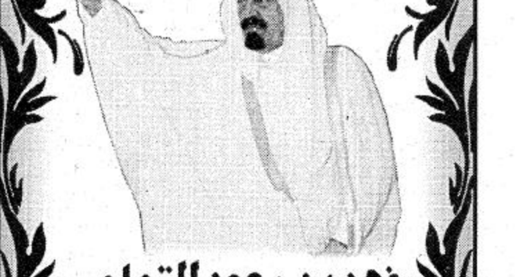
فهد بن سعود التهامي

ومنسوبو المركز يرحبون بمقدم صاحب السمو الملكي الأمير عبدالعزيز بن سعود العرزي ولي العهد ونائب رئيس مجلس الوزراء ورئيس الحرس الوطني وصحبه الكرام في زيارتهم الميمونة لمنطقة عسير متمنين من الله العلي القدير أن يحفظ لنا حكومتنا الرشيدة بقيادة خادم الحرمين الشريفين الملك فهد بن عبدالعزيز آل سعود حفظه الله