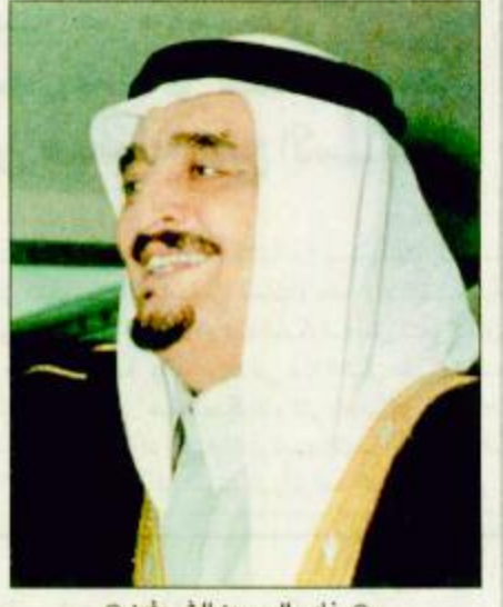
○ خادم الحرمين الشريفين

○ جدة-واس: بعث خادم الحرمين الشريفين الملك فهد بن عبدالعزيز آل سعود برقية تهنئة إلى فخامة الرئيس فرانك البرت رينيه رئيس جمهورية سيشل بمناسبة ذكرى اليوم الوطني لبلاد. وقد أعرب الملك الفدي باسمه وباسم شعب وحكومة المملكة العربية السعودية عن أصدق التهاني مقرونة بتعازيلته بدم الصحة والسعادة لخاتمته والتقدم والأتمنار لشعب سيشل الصديق.