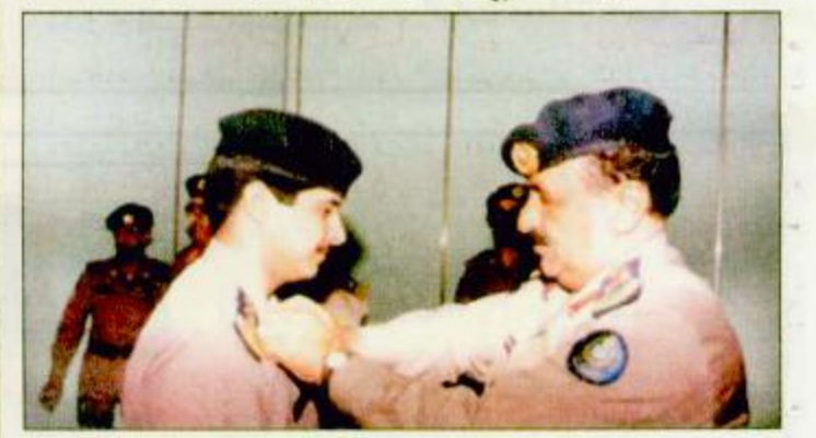
التويجري يقلد أحد الضباط ورتبته

الرياض - أحمد القرني: قام مدير عام الدفاع المدني بالنيابة اللواء / سعد بن عبدالله التويجري بحضور كبار ضباط الجهاز أمس السبت بتقليد عدد من ضباط المديرية العامة للدفاع المدني رتبهم الجديدة وذلك بعد أن صدر الأمر السامي الكريم بتاريخ 72، واثنا إلى رتبة مقدم و72، نقيب إلى رتبة رائد و161 ملازم أول إلى رتبة نقيب. هذا وقد أعرب المرقدون عن عظيم شكرهم وامتنانهم على هذه الثقة الكريمة من ولادة الأمر سائلين الله أن تكون عوناً على طاعة الله ثم خدمة هذا الوطن المعطاء.