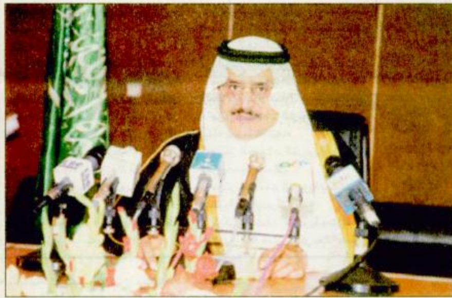
○ الأمير نايف خلال اجابته على أسئلة الصحفيين

موضوع العمالة ليس له علاقة بالاتفاقية والإخوة اليمنيون محل الترحيب والتقدير