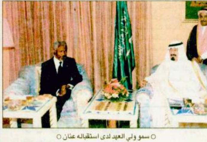
○ سمو ولي العهد لدى استقباله عنان

○ المغرب- الدار البيضاء-واس: استقبل صاحب السمو الملكي الأمير عبدالله بن عبدالعزيز ولي العهد و نائب رئيس مجلس الوزراء ورئيس الحرس الوطني أمس في مقر إقامة سموه في المملكة المغربية الشقيقة معالي الأمين العام للأمم المتحدة كوفي عنان والوفد المرافق له. وقد جرى خلال الاستقبال بحث شامل لحمل القضايا الدولية الراهنة. وحضر الاستقبال صاحب السمو الملكي الأمير سعود الفيصل وزير الخارجية وصاحب السمو الملكي الأمير (طالع ص ٣) البقية ص ٣٣.