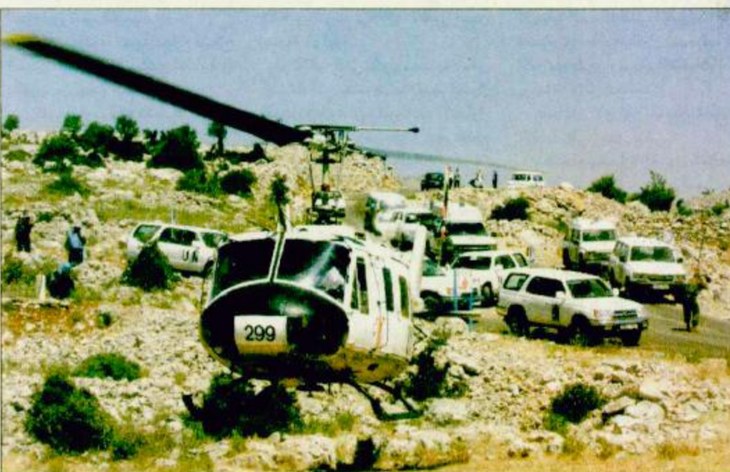
○ لبنان-أ.ف.ب: مروحية تابعة للقوات الدولية تغادر المعسكر الدولي للاشراق على عملية الانسحاب الإسرائيلي من الجنوب اللبناني.

○ بيروت- الوكالات: أصدر رئيس وزراء لبنان سليم الحص أمس السبت على أن إسرائيل ما زالت تحتل أراضي في جنوب لبنان ودعا الأمم المتحدة للمساعدة في ضمان انسحاب كامل. وبعد يوم من إعلان الأمين العام للأمم المتحدة كوفي عنان أن إسرائيل انسحبت بالكامل من المنطقة المحتلة في جنوب لبنان قال الحص لرويترز «من الواضح لنا والمفروق للتحقق اللبناني بأن هناك ستة مواقع إسرائيلية عسكرية لا تزال قائمة على الأرض اللبنانية بينما لا تزال أراضٍ لبنانية أخرى تحت السيطرة الإسرائيلية». وأضاف «نحن نأمل بأن تسارع في الحال الأمم المتحدة لعلاجية هذا الوضع لأننا لسنا مستعدين للتخلي ولو عن شهر من أرضنا». وتابع الحص أن لبنان سيواصل التعاون مع الأمم المتحدة لضمان تنفيذ مهمتها في الجنوب. ورفض رئيس الوزراء اللبناني أمس الأول تأكيد عنان على أن إسرائيل اتت انسحابها من جنوب لبنان البقية ص ٣٣.