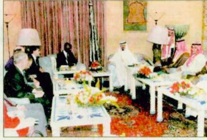
لقطان من استقبال سمو ولي العهد للأمين العام للأمم المتحدة