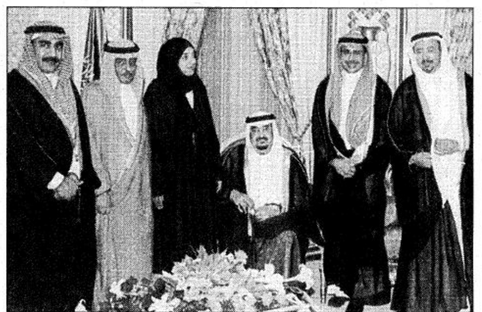
○ الفريق الطبي لدى تشرفه بمقابلة خادم الحرمين الشريفين

صاحب السمو الملكي الأمير نايف بن عبدالعزيز بعد اذاعة الخبر في مكتب سموه واستمر لمدة ساعتين وقد شعر الفريق العلمي بأن الأمير نايف من الشخصيات المتميزة الذين يعملون في صمت ويستعملون لكافة الملاحظات. وقد خرج أفراد الفريق الطبي بانطباع بأن اللقاء الثاني لم يقل روعة عن اللقاء الأول فقد كان الأمير نايف يستمع لكل شخص من أفراد الفريق الطبي على حدة بل إن سموه الكريم وجه جامعة الملك عبدالعزيز ووزارة التعليم العالي بتبني هذا الانجاز.