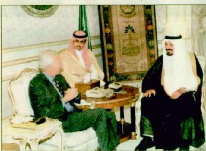
□ الأمير سلطان لدى استقباله لسفير سيراليون □ محرم ١٤٢٠هـ وذلك بقاعة ليلتي بمدينة جدة. من جهة أخرى استقبل صاحب السمو الملكي الأمير سلطان بن عبد العزيز الثاني لرئيس مجلس الوزراء والطيران والفن والشباب ورئيس مجلس إدارة الخطوط الجوية العربية السعودية اجتماع الدورة الثانية والثلاثين للجمعية العمومية للاتحاد العربي للنقل الجوي يوم الأحد التاسع من شهر

استقبل سفير سيراليون لدى ألمانيا ووايتش فولر الأمير سلطان يرعى اجتماع الدورة « ٣٢ » للاتحاد العربي للنقل الجوي .. الأحد القادم