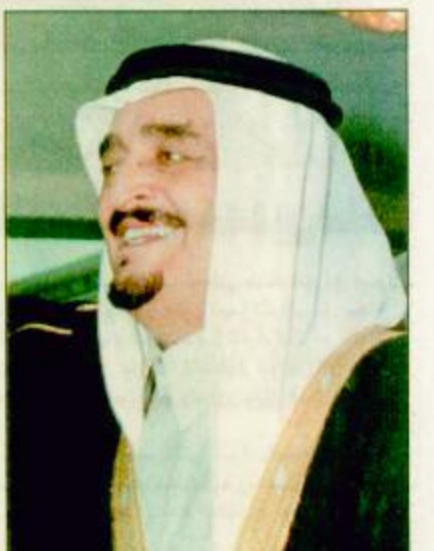
□ البقاع: ص ٢٩