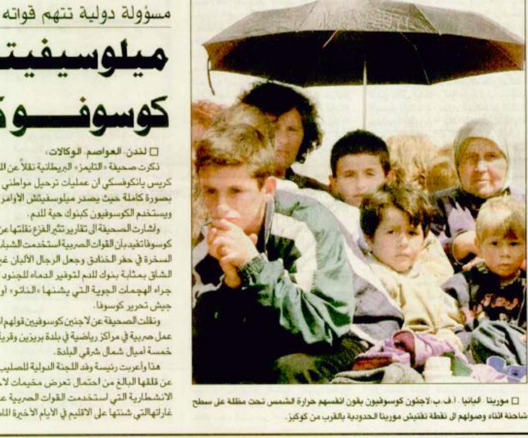
□ مورتينا: اجانيا: اب ب لاجئون كوسوفيون يظنون انفسهم حرارة الشمس تحت مظلة على سطح شاحنة أثناء وصولهم إلى نقطة نقاش مورتينا الحدودية بالقرب من كوتيز.

□ لندن: العواصم: الوكالات، ذكرت صحيفة «التايمز» البريطانية نقلاً عن المتحدث باسم المفوضية كريس يانوكوفسكي أن عمليات ترحيل مواطني كوسوفا قد استؤنفت بصورة كاملة حيث يصدر ميلوسيفيتش الأوامر بعملية تطهير عرقي ويستهدف الكوسوفيين كبنوك حياة للدم. ولشارت الصحيفة في تقارير نشرها عن اللاجئين الفارين من كوسوفا تفويدياً القوات الصربية استخدمت الشباب الألبان للعمل بنظام السخرة في حفر الخنادق وجعل الرجال الألبان غير القادرين على العمل الشاق بمثابة بنوك للدم لتوفير الدماء للجنود الصرب المصابين من جراء الهجمات الجوية التي يشنها «الناتو» أو الذين يقتلون ضد جيش تطهير كوسوفا. ونقلت الصحيفة عن لاجئين كوسوفيين قولهم أنه تم إنشاء معسكرات عمل صربية في مراكز رياضية في بلدة بريزين وقريبة زيلوم التي تبعد نحو خمسة أميال شمال شرقي البلدة. هذا وأعلنت رئيسة وفد اللجنة الدولية للصليب الأحمر أريان توميه عن قلقها البالغ من احتمال تعرض مخيمات لاجئي كوسوفا للقنابل الانشطارية التي استخدمت القوات الصربية عدداً كبيراً منها خلال غاراتها التي شنتها على الاقليم في الأيام الأخيرة للشيبة.