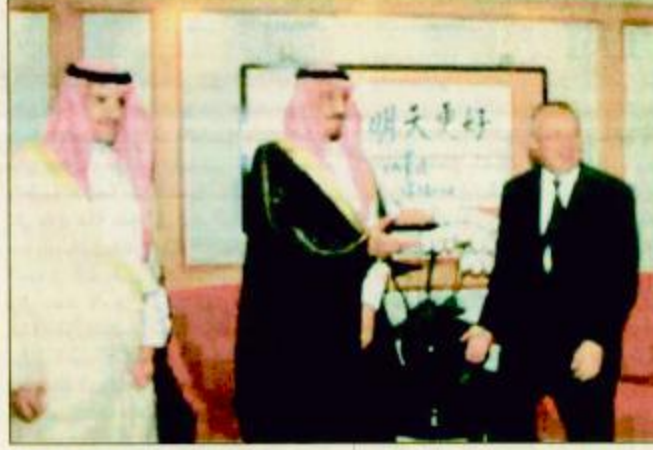
□ الأمير سلمان لدى زيارته لحاكم هونج كونج □ (واس) صاحب السمو الملكي الأمير عبدالله بن عبدالعزيز ولي العهد إلى الصين في أكتوبر الماضي. هذا وأوضح السفير الصيني أن سمو الأمير

□ الرياض: صالح الفالح: هونج كونج: واس: يبدأ صاحب السمو الملكي الأمير سلمان بن عبدالعزيز أمير منطقة الرياض اليوم «الأحد» زيارة رسمية إلى جمهورية الصين الشعبية تستغرق أسبوعاً وذلك في مستهل الجولة السنوية لسموه والتي تشمل أيضاً كلاً من كوريا الجنوبية، والفلبين وذلك تلبية لدعوات رسمية تلقاها سموه من حكومات البلدين الثلاث. وقد رحب سعادة سفير جمهورية الصين الشعبية لدى المملكة السيد يوزينجرهي باسم الحكومة الصينية بزيارة الأمير سلمان إلى الصين واستقبل في تصريح خاص لـ الجزيرة، الزيارة بأنها هامة جداً على صعيد دعم العلاقات وتعزيز التعاون الثنائي المشترك فيما يخص مستقبل البلدين والشعبين الصديقين. وأشار إلى أن زيارة سمو الأمير سلمان تأتي بعد الزيارة الناجحة والتاريخية التي قام بها