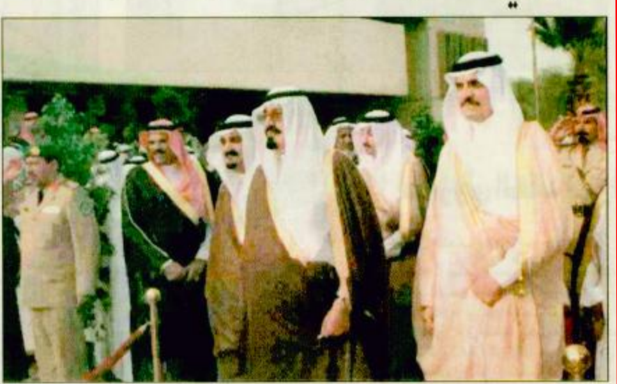
□ سمو ولي العهد يشرع في وضع حجر الأساس

□ الأحساء: عبدالله المحم. عبدالله الحسن السعود. واس: قام صاحب السمو الملكي الأمير عبدالله بن عبدالعزيز ولي العهد ونائب رئيس مجلس الوزراء ورئيس الحرس الوطني بوضع حجر الأساس لمصنع الأقمشة التابع للشركة السعودية اليابانية لصناعة الأقمشة إحدى شركات الأحساء للتنمية. وبعد ذلك قام صاحب السمو الملكي الأمير عبدالله بن عبدالعزيز وصحبه الكرام بجولة في شوارع الأحساء حيث أطلع سموه على مدى تكامل الخدمات. ثم شرف بعد ذلك حفل اهالي المحافظة. وكان سموه قد وصل أمس إلى محافظة الأحساء قادماً من الدمام وذلك ضمن جولات سموه التفقدية في محافظات المنطقة الشرقية التي رعى وشدن خلالها عدداً من مشروعات الخير والتنمية فيها. وخلال مرور سموه بمحافظة بقيق توقف سمو ولي العهد في لفة إقليمية حانية وشارك ابنائه اهالي المحافظة بقيق احتفالهم بزيارة سموه للمنطقة كما تناول سمو ولي العهد القهوة العربية واستقبله محافظ بقيق ورامع ومنسوبو الفوج الأربعين بالحرس الوطني وقدم مجموعة من الأطفال باقات من ورود لسموه وتشراف اهالي بقيق بالسلام على سمو ولي العهد.