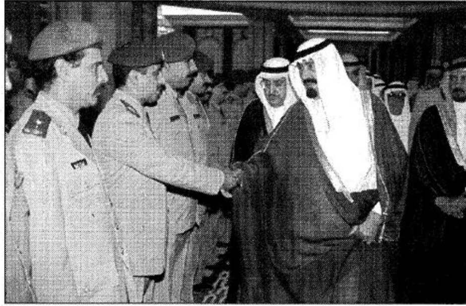
لغات من استقبال في العهد لأمراء والوزراء والوطنيين