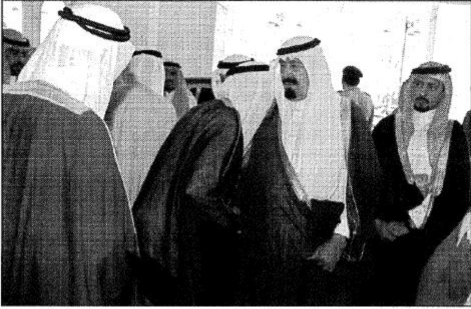
صور من وس