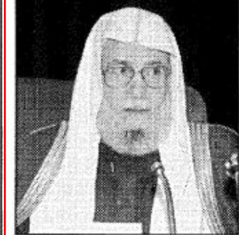
الشيخ فهد بن عبد العزيز

وجه خادم الحرمين الشريفين الملك فهد بن عبدالعزيز آل سعود - حفظه الله ورعاه - بتزويد عدد من الجهات الحكومية والمؤسسات والهيئات الإسلامية في الداخل والخارج ال جانب سفارات وممثلات المملكة في الخارج، بما مجموعه ستون ألف نسخة من القرآن الكريم بمختلف الاصناف وترجمات معانيه، بعدد من اللغات من إصدار مجمع الملك فهد لطباعة المصحف الشريف بالدينة المنورة.