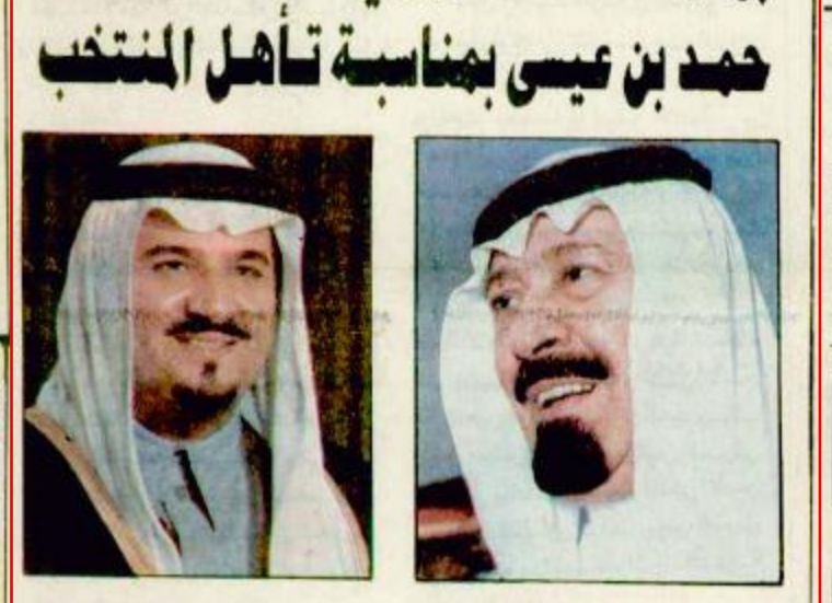
تلقى صاحب السمو الملكي الامير عبد الله بن عبدالعزيز في العهد ونائب رئيس مجلس الوزراء ورئيس الحرس البلقية ص ٣٠