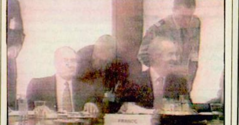
الرئيس الفرنسي براس وفد بلاده عقد رؤساء الدول والحكومات في المجموعة الأوروبية امس الجمعة في بروكسل بطلب من المانيا قمة استثنائية استغرقت يوما واحدا بمناسبة دخول البلقية ص ٣٠