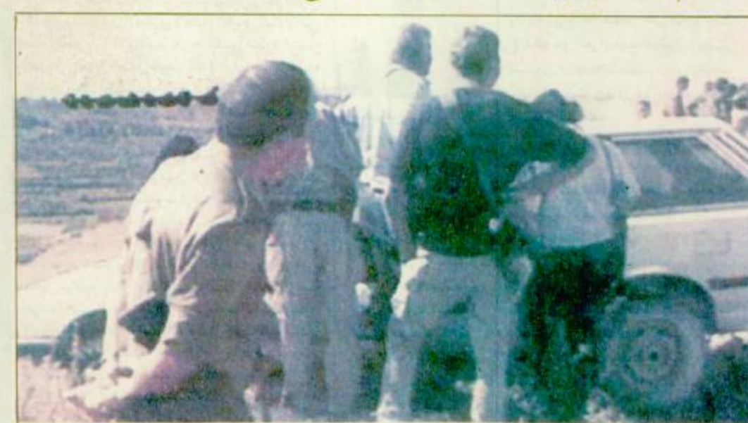
تجمع حول سيارة المستوطن الاسرائيلي المقتول

ذكر الراديو الاسرائيلي امس ان مكان عقد المفاوضات الفلسطينية الاسرائيلية الخاصة بتنفيذ اتفاق غزة - اريحا يتغير من طابا الى العريش أو القاهرة للابتعاد عن وسائل الاعلام حسب قول الراديو ومعروف ان هذه المفاوضات متوقفة الآن بسبب خلافات حول موضوع الانسحاب من غزة طبقا للاتفاق الموقع بين اسرائيل ومنظمة التحرير الفلسطينية في الثالث عشر من سبتمبر الماضي في واشنطن حيث تريد اسرائيل اعادة نشر قواتها في غزة وليس سحبها كما ينص الاتفاق وبصر عليها الجانب الفلسطيني ومن المتوقع طبقا لـ وق. ن. ا. استئناف هذه المفاوضات خلال ايام - البقية ص ٣٠ -