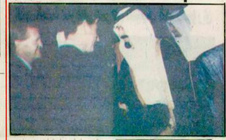
عقد مساء امس اجتماع بين صاحب السمو الملكي الامير عبد الله بن عبدالعزيز وزير الدفاع وصاحب السمو الملكي الامير تشارلز في عهده بريطانيا وأميروليز

وقد جرى خلال الاجتماع طبقا لـ «واس» تبادل الاحاديث الودية وبحث العلاقات الثنائية بين البلدين وحضر الاجتماع سفير خادم الحرمين الشريفين لدى بريطانيا الدكتور غازي بن عبد الرحمن القصيبي وسفير بريطانيا لدى المملكة السيد بيفيد جويوت بدء الانتخابات النيابية الابدنية اليوم الجزيرة محمد المجاني صباح اليوم يتوجه الناخبون الابدنية البالغ عددهم ١.٢٠٣.٣٢٩ ناخب لانتخاب ممثلهم في مجلس النواب القادم وزير الداخلية دعا المواطنين الى ضرورة المحافظة على الهدوء والنظام أثناء الاقتراع كما طالب النواب بضرورة التزام الهدوء