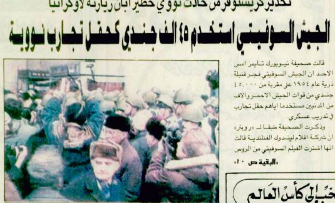
جنود روس يرفقون بقاهرة في موسكو