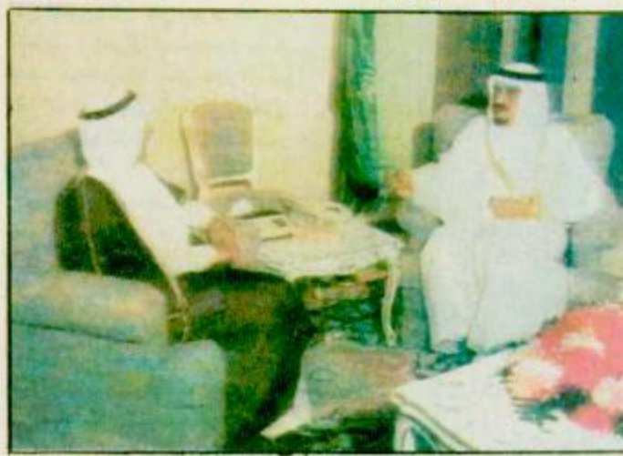
استقبل خادم الحرمين الشريفين الملك فهد بن عبدالعزيز آل سعود في مكتبه بقصر السلام

ذكر الراديو الاسرائيلي امس ان مكان عقد المفاوضات الفلسطينية الاسرائيلية الخاصة بتنفيذ اتفاق غزة - اريحا يتغير من طابا الى العريش أو القاهرة للابتعاد عن وسائل الاعلام حسب قول الراديو ومعروف ان هذه المفاوضات متوقفة الآن بسبب خلافات حول موضوع الانسحاب من غزة طبقا للاتفاق الموقع بين اسرائيل ومنظمة التحرير الفلسطينية في الثالث عشر من سبتمبر الماضي في واشنطن حيث تريد اسرائيل اعادة نشر قواتها في غزة وليس سحبها كما ينص الاتفاق وبصر عليها الجانب الفلسطيني ومن المتوقع طبقا لـ وق. ن. ا. استئناف هذه المفاوضات خلال ايام - البقية ص ٣٠ -