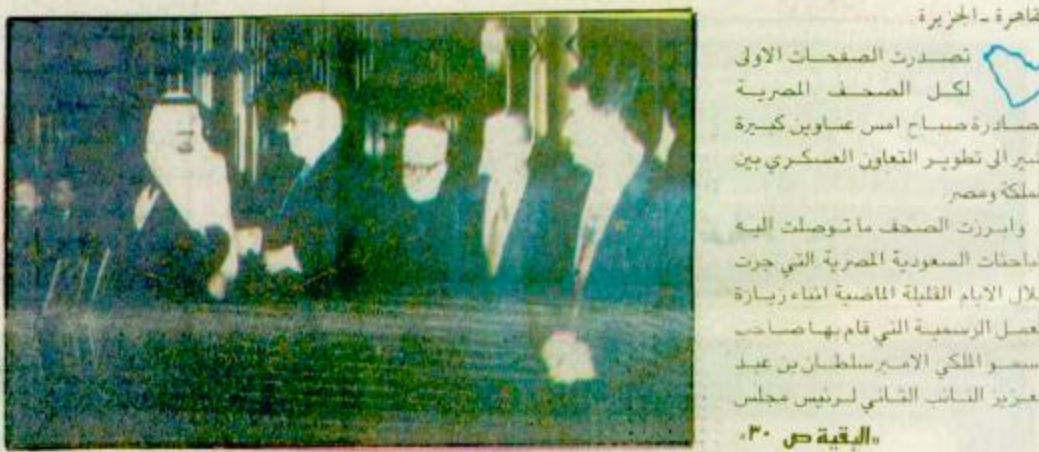
الغاية - الجزيرة