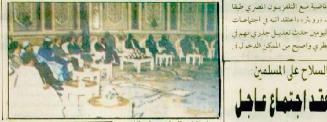
رئيس مجلس الشورى يستقبل وزراء والشعبان بأعماله من اهل الشورى.