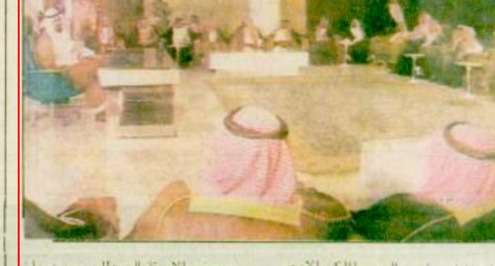
استقبل صاحب السمو الملكي الامير عبد الله بن عبد العزيز ولي العهد نائب رئيس مجلس الوزراء ورئيس الحرس الوطني بعد ظهر امس امراء أنوار الحرمين الوطني.