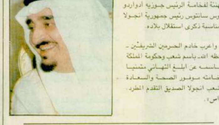
يعت خادم الحرمين الشريفين الملك فهد بن عبدالعزيز آل سعود برقية تهنئة لفخامة الرئيس جوسيه ادوارو دوس سانتوس رئيس جمهورية انجولا بمناسبة ذكرى استقلال بلاده.