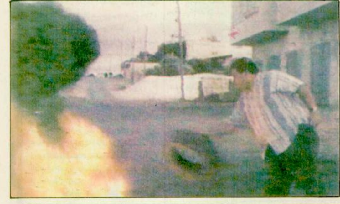
مشهد من إحدى المستوطنات الإسرائيلية في غزة.

الانحساح الاسرائيلي من اريحا التفاصيل مقترين كحل الاقتراب من مفهوم الانحساح الحقيقي لا اعادة الانتشار. وأضاف قوله: اعتقد ان هناك تقدما حدث لن احوض في التفاصيل لكن بدون هذا التقدم لم يكن ممكنا العودة الى هذه المفاوضات والحوض فيها بالتفاصيل المطلوبة. وصرح شعث بيان المحادثات مستأنف في متجع طابا المصري الاسبوع القادم واعرب عن ثقته بإمكانية تحقيق تقدم وقال نحن على وشك تحقيق نتائج. وذكر شعث ان نجاح خطة