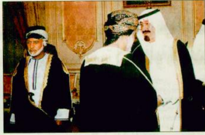
لقطات من حفل العشاء الذي اقامه نائب خادم الحرمين تكريماً للسلطان قابوس □