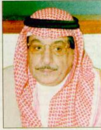
وزير المواصلات □

□ الخرمة - سعد الخرجي بوصل معالي وزير المواصلات الدكتور ناصر بن محمد السلوم اليوم الخميس جولته التفتحية للمناطق التابعة لمحافظة الطائف ويرافق معاليه في الجولة معالي محافظ الطائف فهد بن عبدالعزيز بن معمر ووكيل وزارة المواصلات المساعد للتخطيط والمتابعة المهندس عبدالعزيز التويجري ووكيل وزارة المواصلات المساعد للشؤون الفنية المهندس علي التميم ومدير عام الطرق والنقل بمنطقة مكة المكرمة المهندس فرح محمد الزهراني ومدير عام الصيانة بوزارة المواصلات المهندس محمد السويكيت ومدير عام الدراسات والتصميم المهندس احمد الجندلي ومدير الطرق والنقل بمحافظة الطائف المهندس شرف الحسيني.