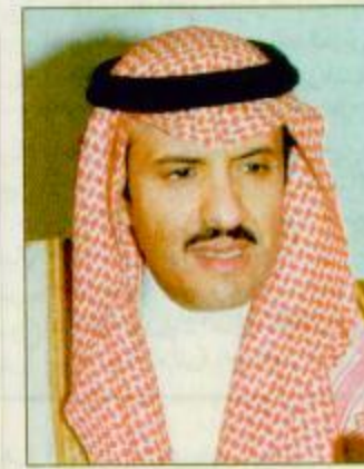
الامير سلطان بن سلمان □

□ لندن - الجزيرة نشأت شبكة التأهيل الدولية التي تتخذ من لندن مقراً لها بالمرور الرئيسي لصاحب السمو الملكي الامير سلطان بن سلمان بن عبدالعزيز في مسابقة مسودة «ميثاق الالفية» الجديدة، المبرور حالياً في الاجتماع رفيع المستوى الخاص بشبكة التأهيل الدولية والمتخذ حالياً في لندن ويستمر حتى التاسع من هذا الشهر وقلت ان ما قام به سمو الامير سلطان بن سلمان من اسهام في صياغة مسودة الميثاق سيكون له الاثر الكبير في مساعدة ملايين الناس في جميع أنحاء العالم على الهروب من شبح العجز والعلقة.