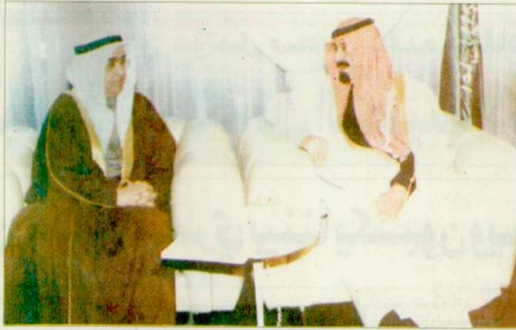
الرياض - واس: استقبل صاحب السمو الملكي الامير عبد الله بن عبد العزيز ولي العهد ونائب رئيس مجلس الوزراء ورئيس الحرس الوطني في مكتب سموه برئاسة الحرس الوطني امس جموعاً من المواطنين الذين قدموا للسلام على سموه. وفي اللقطة الثانية سموه يستقبل وزير الخارجية البحريني الشيخ محمد بن مبارك آل خليفة

ولا غرابة في ان تولي الملكة اهتمامها لهذين القطاعين، فالمسجد والمدرسة يمثلان ركيزة التنمية «بشرية واقتصادية» والانسان هو مخرجات العقيدة التي يعتنقها والتعليم الذي يناله ويحظى به، وبعد ذلك تأتي القطاعات الاخرى كما يريد لها هذا الانسان ان تكون عليه وبهذا المعنى يصبح مركز الامير سلمان التعليمي وبقية المشروعات في القطاع الحيويين نخائر تدعم التواصل بين ابناء البلدين لانها مشروعات تلامس احتياجات الروح والعقل، والبدان - الملكة ومصر - لديهما فهم متبادل بان اشباع هذين العنصرين يمضي قدماً بالعلاقة المتميزة بينهما لتتطور في المجالات كافة.