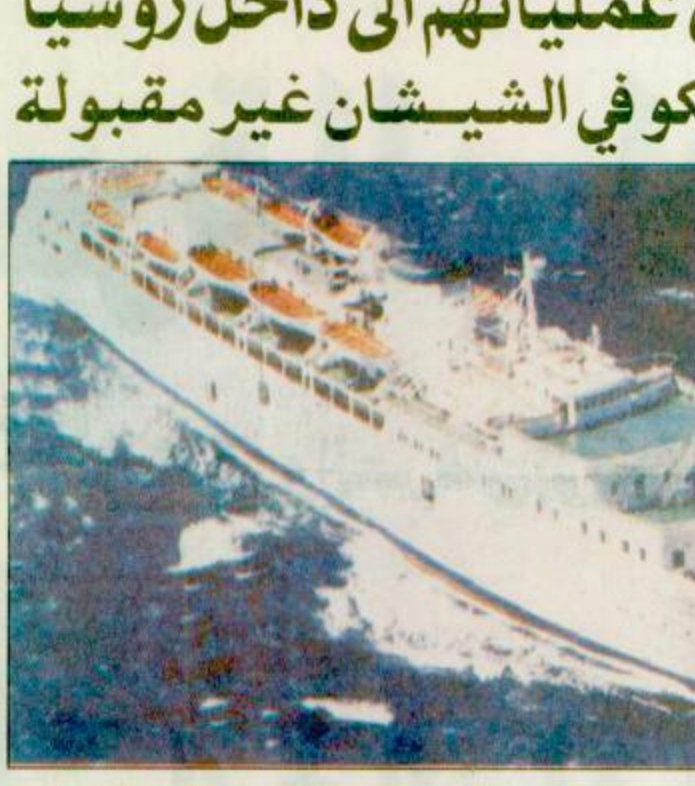
● صورة أرشيفية حديثة توضح سفينة الركاب التركية «الفراس» التي يهدد المقاتلون الشيشان بنسفلها غير ان مسئولا امنيا آخر قال انه ليس في مقدور موسكو التأكيد بان جميع الرهائن قد لقا حتفهم. على صعيد آخر للحرب الروسية- الشيشانية فيما

انقرة - اسطنبول - جروزني - موسكو - الوكالات: حذر قائد عسكري للثوار الشيشان الحكومة الروسية من حرب واسعة النطاق داخل روسيا يشنها الثوار الشيشانيون.. وقال القائد اصلان ماسخادوف هو ضباط سابق في الجيش السوفييتي من قاعدته في الجزء الذي يسيطر عليه الثوار الشيشان في العاصمة جروزني قال ان اصعب لحظات الحرب تأتي عندما يخرج من نطاق الحدود الشيشانية اشارة الى احتمال نقل الحرب الشيشانية الى داخل روسيا.