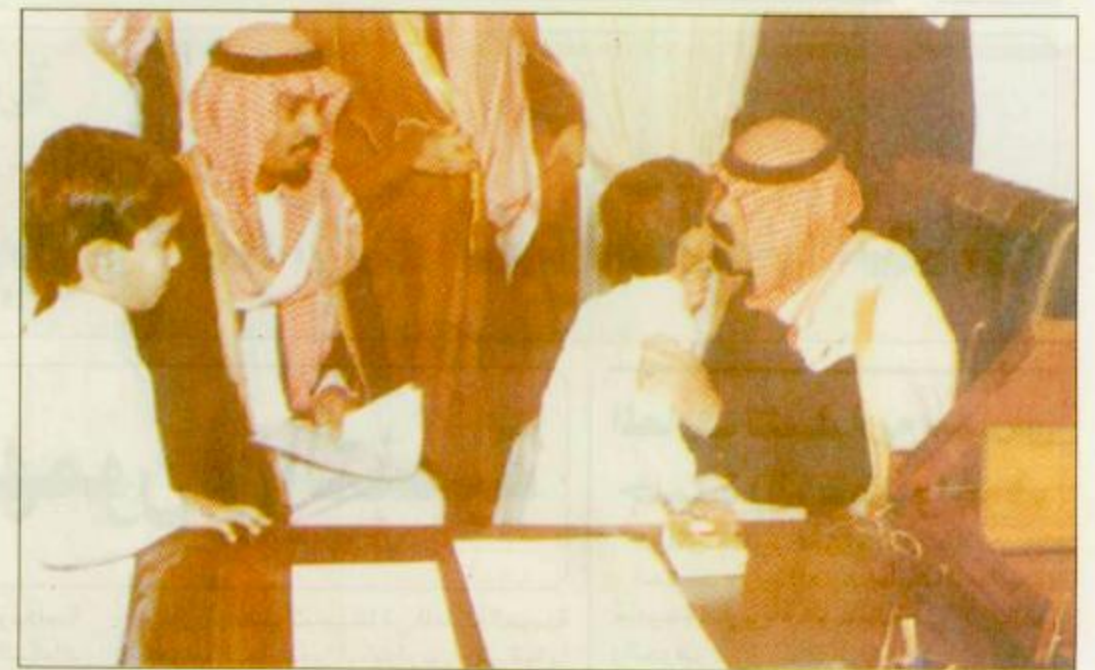
الرياض - واس: استقبل صاحب السمو الملكي الامير عبد الله بن عبد العزيز ولي العهد ونائب رئيس مجلس الوزراء ورئيس الحرس الوطني في مكتب سموه برئاسة الحرس الوطني امس جموعاً من المواطنين الذين قدموا للسلام على سموه. وفي اللقطة الثانية سموه يستقبل وزير الخارجية البحريني الشيخ محمد بن مبارك آل خليفة