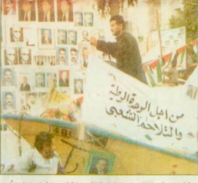
● أريحا - فلسطين: الحملات الانتخابية الفلسطينية تجوب الشوارع استعداداً لأول انتخابات فلسطينية عامة في مختلف أنحاء الضفة الغربية وقطاع غزة يوم السبت القادم.