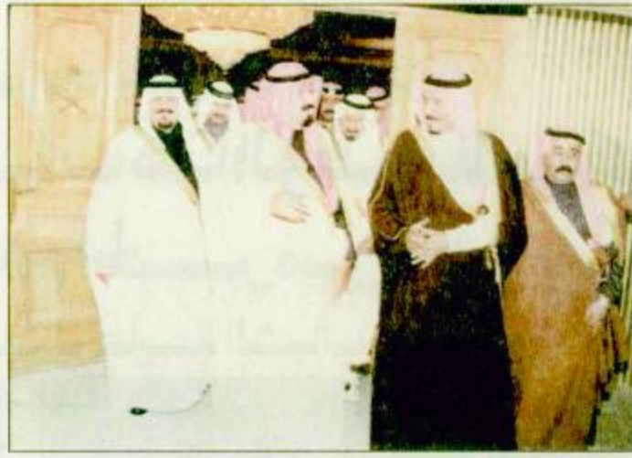
○ سمو ولي العهد يصل الرياض ○