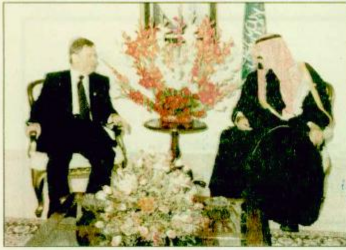
○ سمو ولي العهد يستقبل نائب رئيس الجمهورية السورية ○