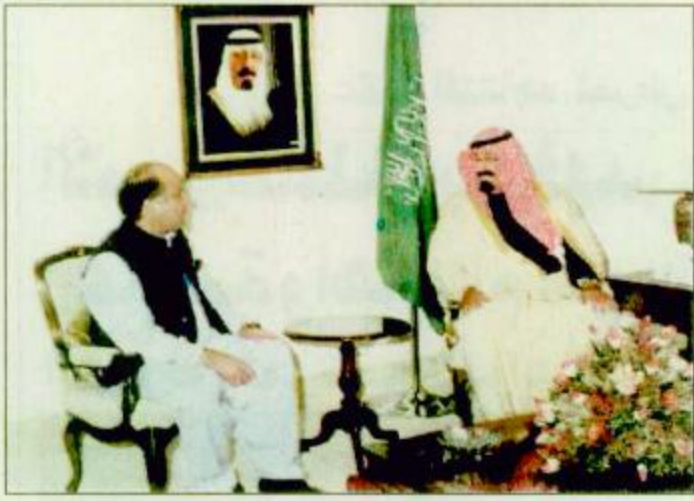
○ سمو ولي العهد يستقبل رئيس وزراء باكستان ○