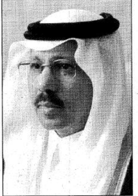
وزير برق والبريد والهاتف