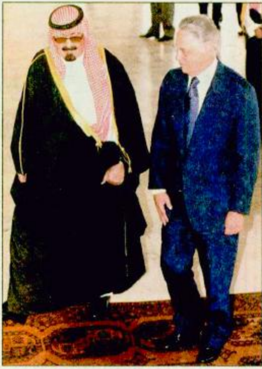
○ سمو ولي العهد لى وصوله الى برازيليا

مؤكدة على ضرورة وأهمية الحفاظ على سلامة العراق ووحدة الإقليمية.