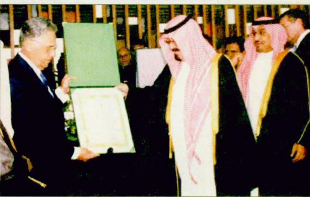
○ سمو ولي العهد والرئيس البرازيلي يتبادلان تقليد الوسمة