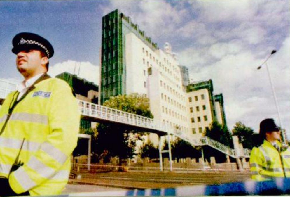
○ لندن-بريطانيا: الشرطة البريطانية تقف امام مبنى الاستخبارات في وسط لندن بعد اصابته بصاروخ الليلية الماضية أدت الى تصدع بسيط في اعلى المبنى.

○ لندن - الوكالات: قالت الشرطة ان «صاروخاً صغيراً» أطلق على الواجهة الخارجية لمقر جهاز المخابرات البريطاني «أم أي ٦» في وسط لندن. وقال الآن فراي رئيس شرطة مكافحة الإرهاب للصحفيين في مكان الانفجار في ساعة مبكرة من صباح أمس الخميس ان الصاروخ أصاب الطابق الثامن من المبنى الذي يخضع لاجراءات أمن مشددة لكنه لم يسفر سوى عن خسائر مادية طفيفة. ولم يتمكن فراي من تحديد هوية من أطلق الصاروخ لكنه قال: «من الواضح انني يجب ألا أفعل قدرات الجماعات الإرهابية المنشقة، لكن في هذه المرحلة فأنني لا أستبعد أي جماعة أخرى قد تعتبر جهاز المخابرات هدفاً محتملاً». ولم ترد أي تقارير عن اصابات أحد بأذى في الهجوم. وقال فراي: «ان حصلاً للواجهة الخارجية للمبنى يظهر ان صاروخاً صغيراً أصاب المبنى عند الطابق الثامن. وقد أحدث اضطراباً طفيفاً». وأضاف قائلاً: «طبيعة عمل جهاز المخابرات يعني ان هناك جماعات ارهابية أخرى في مختلف أنحاء العالم قد تعتبر منشآت هدفها محتملاً». ومضى فراي قائلاً: «يجب علينا جميعاً ان نكون يقظين. لدينا تهديد عام للإرهاب في لندن». ولم يصدر أي تحذير من الهجوم قبل وقوعه ولم يعلن احد حتى الآن المسؤولية عنه. وقال فراي انه لا يعتقد ان المبنى أصيب بقذيفة مورتر «هاون» لأن هذا كان من شأنه ان يحدث قدراً أكبر من الأضرار.