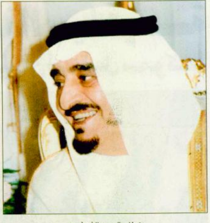
○ خادم الحرمين الشريفين