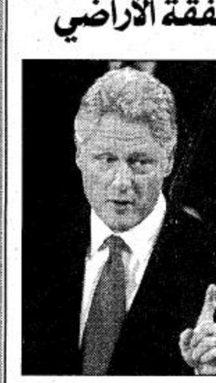
المحقق يبريء كلينتون وزوجته من صفقة الأراضي

واشنطن - رويترز: قال روبرت واي المحقق الأمريكي المستقل انه ليس هناك أدلة كافية لتوجيه اتهامات جنائية للرئيس الأمريكي بيل كلينتون وزوجته هيلاري فيما يتعلق بصفقة وايتواتر للأراضي في ولاية أركنسو.