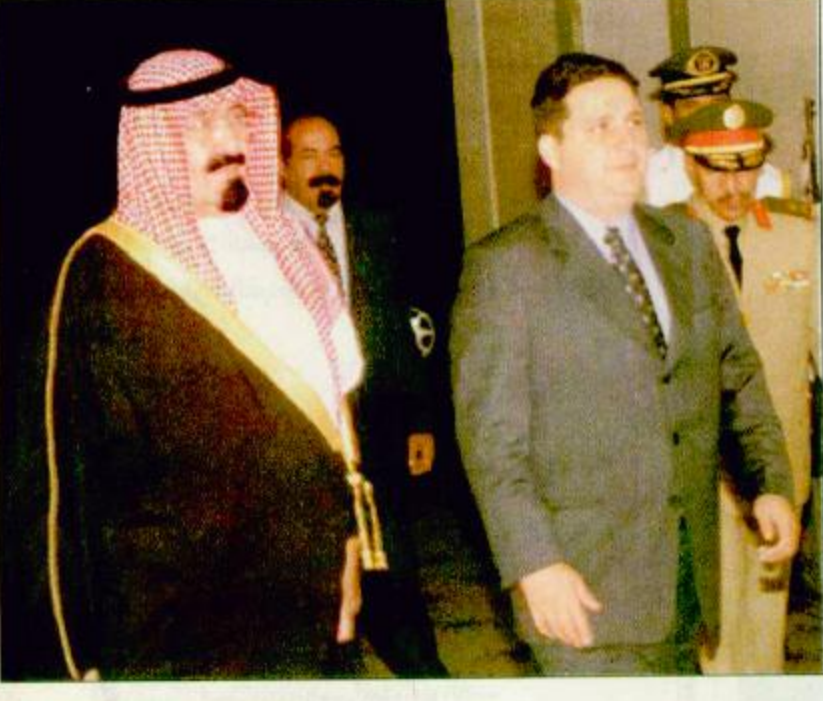
○ حاكم ريو دي جانيرو يستقبل سمو ولي العهد

○ ريو دي جانيرو - من رئيس التحرير-واس: استقبل حاكم مدينة ريو دي جانيرو البرازيلية انتوني فاروتينو صاحب السمو الملكي الامير عبدالله بن عبدالعزيز ولي العهد نائب رئيس مجلس الوزراء ورئيس الحرس الوطني مساء أمس الأول في مقر إقامة الحاكم بمدينة ريو دي جانيرو. وقد عقدا اجتماعاً حضره صاحب السمو الملكي الامير نواف بن عبدالعزيز وصاحب السمو الملكي الامير عبدالله بن عبدالعزيز أمير منطقة الجوف كما حضره عدد من المسؤولين البرازيليين. وقد تطرق الحديث خلال هذا الاجتماع الى عدد من القضايا التي تهم البلدين وتخدم مصالحهما المشتركة وتعزز التعاون في كافة المجالات. بعد ذلك تبادل سمو ولي العهد وحاكم ريو دي جانيرو الهدايا بهذه المناسبة. من جهة أخرى أكد سمو ولي العهد ان العلاقات البرازيلية السعودية ستشهد دفعة قوية بفضل الله ثم بفضل اللقاءات والمباحثات