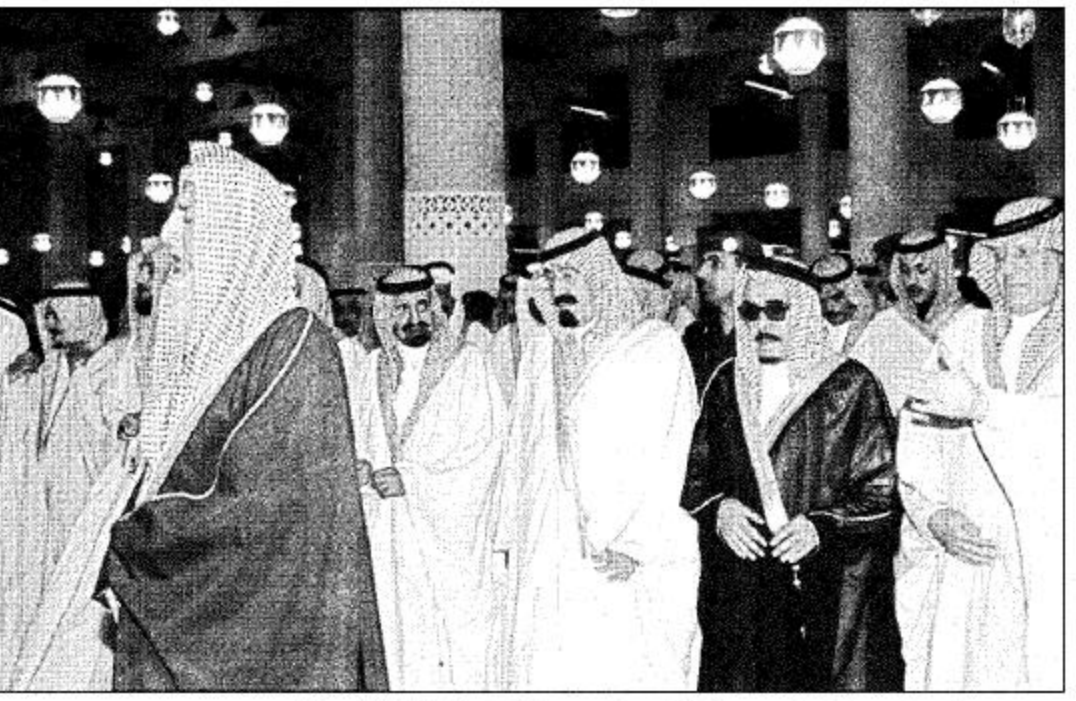
سمو ولي العهد يؤدي صلاة عيد الفطر المبارك

وأكد أن تمسك المسلمين بشرع الله عز وجل وإخلاص العباد له سبحانه وتعالى هما مصدر وحدة المسلمين ومنعتهم في الدنيا والآخرة داعياً إلى أخذ العبرة والعظة والتمسك بالدين القويم مصدر النجاة من كل الشور. وتعاى في ختام خطبته أن يتقبل من المسلمين صيامهم وقيامهم وأن يوحى على طريق الحق صفوهم وينصروهم على عدوهم ويرد كيد أعدائهم وأن يحقق التضامن بين المسلمين لإعلاء كلمتهم وأن يحزن الإسلام والمسلمين ويحفظ على هذه البلاد أمنها واستقرارها. وبعد أن أدى صاحب السمو الملكي الأمير عبدالعزيز صلاة توجه سموه إلى قصر الحكم ولدى وصول سموه أدت ثلة من القوات الخاصة التحية لسموه. ثم استقبل سمو ولي العهد أصحاب السمو العلماء العلماء وأصحاب الفضيلة العلماء وأصحاب المعالي الوزراء وكبار قادة القوات المسلحة والحرس الوطني والأمن العام والقوات الخاصة وجمعاً من المواطنين الذين قدموا لتكريم سموه وللإسلام على سموه وتهنئته بعيد الفطر المبارك. وحضر الاستقبال صاحب السمو الملكي الأمير سلطان بن عبدالعزيز نائب أمير منطقة الرياض.