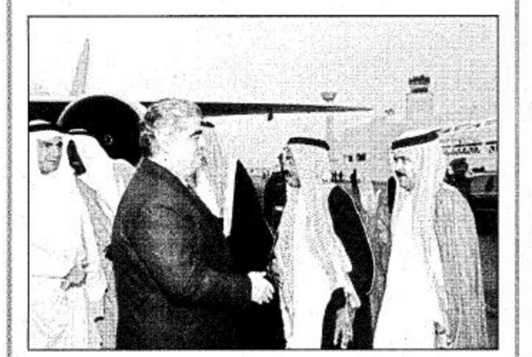
الرياض - واس

وصل إلى الرياض أمس دولة رئيس وزراء لبنان رفيق الحريري. وكان في استقبال دولته بطار قاعدة الرياض الجوية قائد قاعدة الرياض الجوية اللواء الطيار الركن هارون بن جعفر آدم ومندوب عن المراسم الملكية والسفير اللبناني لدى المملكة الدكتور بسام النعماني وأعضاء السفارة.