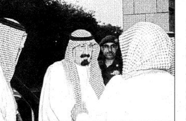
الرياض - واس

وقد تناول الجميع طعام الإفطار على مأدبة سمو ولي العهد. كما استقبل صاحب السمو الملكي الأمير عبدالعزيز بن عبدالعزيز نائب رئيس مجلس الوزراء رئيس الحرس الوطني في قصر سموه بالرياض أمس دولة رئيس وزراء لبنان رفيق الحريري. وجرى خلال الاستقبال تبادل الأحاديث الودية وبحث أوجه العلاقات الثنائية بين البلدين الشقيقين. كما استعرض أهم الأحداث الراهنة على الساحتين الإسلامية والدولية. وحضر الاستقبال السفير اللبناني لدى المملكة الدكتور بسام النعماني.