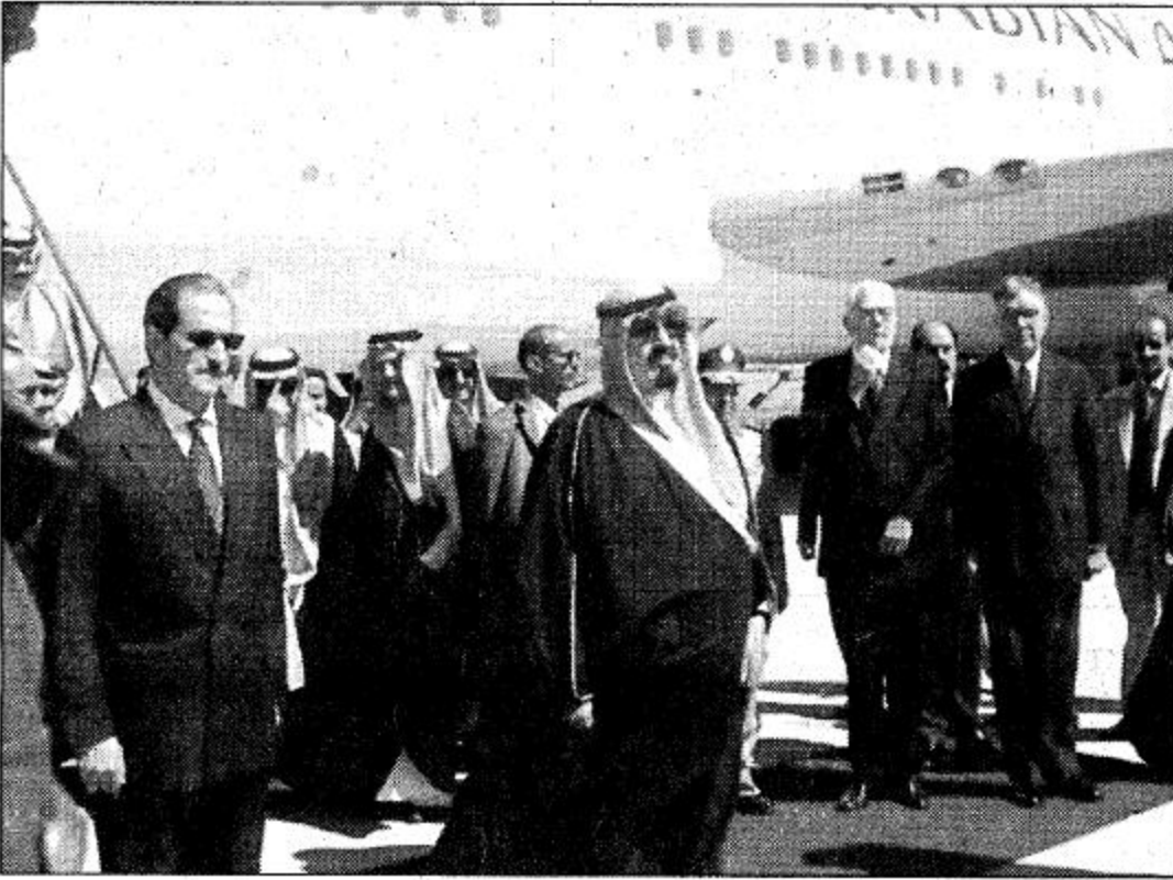
○ وصول سمو ولي العهد إلى البرازيل ○ واس