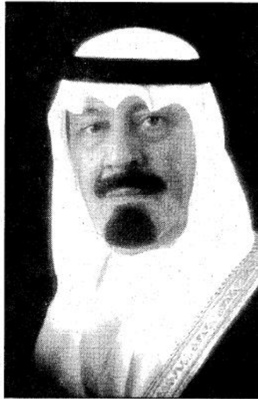
○ سمو ولي العهد ○