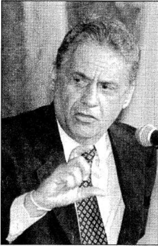
○ الرئيس البرازيلي ○