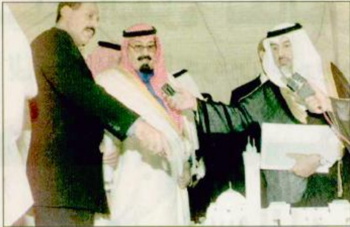
هذا البلد الصديق.

الأمير عبدالله في كلمة لإخوانه المسلمين في جنوب أفريقيا: